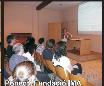
Ponent: Fundació IMA

De cara al curs vinent ja estem pensant noves propostes que esperem que siguin del vostre interès.