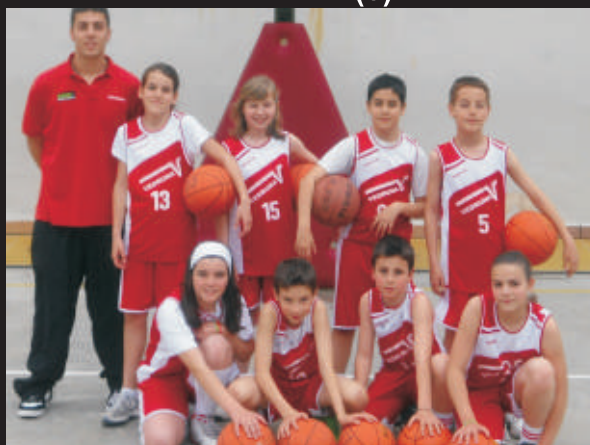
ALEVÍ M (5)