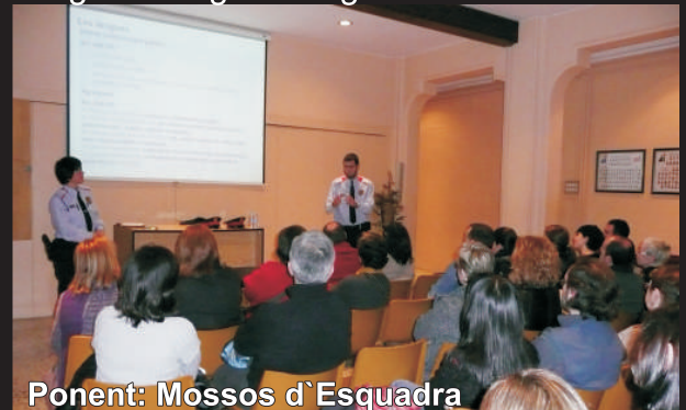
Ponent: Mossos d'Esquadra