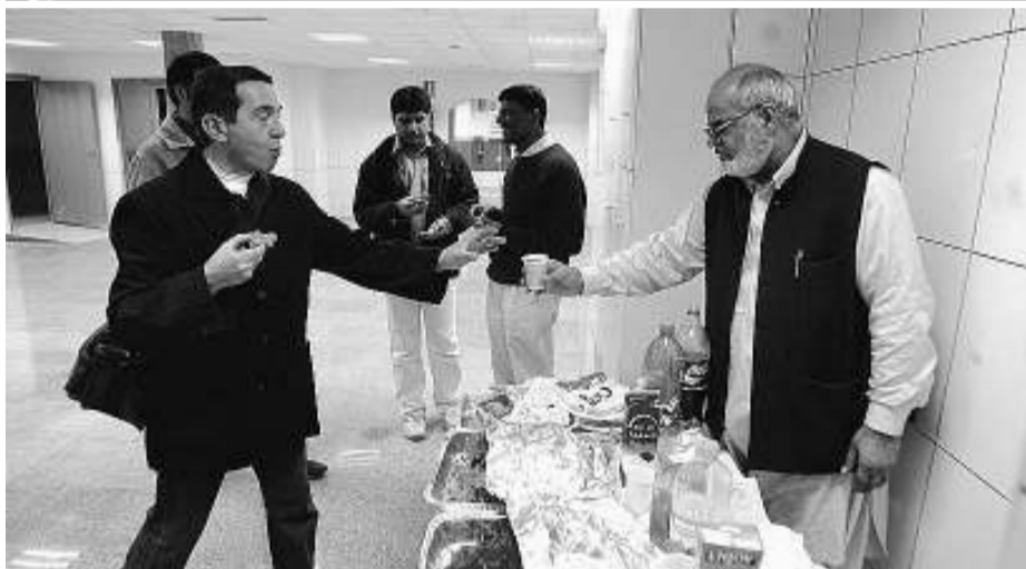
A dalt una imatge de la trobada al temple sikh , a sota, en un centre musulmà.

près amb el sistema d'ajuda mútua dels testimonis de Jehovà. Com Guinot, un centenar de persones van participar en els grups organitzats pel Centre Interreligiós de Barcelona. Les portes d'una vintena