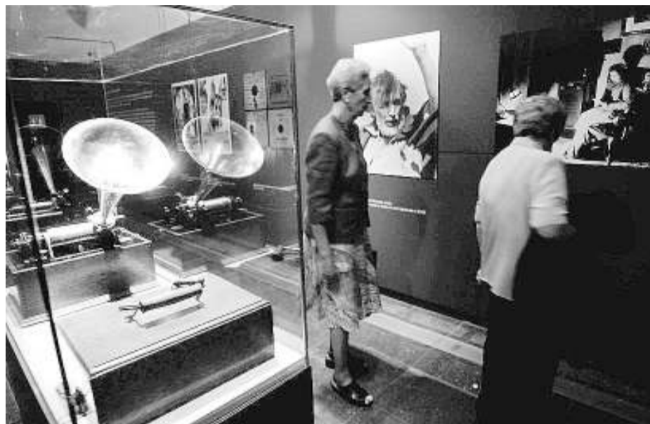
Aquesta és una de les peces que es poden veure a l'exposició Escolta i visiona.