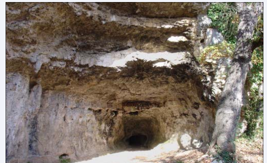
LES COVES DEL TOLL DE MOIÀ FORMEN PART DEL PARC GEOLÒGIC I MINER

El patronat vetllarà perquè el Parc Geològic i Miner de la Catalunya Central promougui el geoturisme, fomenti la recerca i la conservació de la geologia al terri-