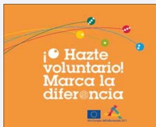
CARTELL AMB LA IMATGE VISUAL DE LA CAMPANYA

Més informació sobre l'Any Europeu del Voluntariat al web http://europa.eu/volunteering/es/home2