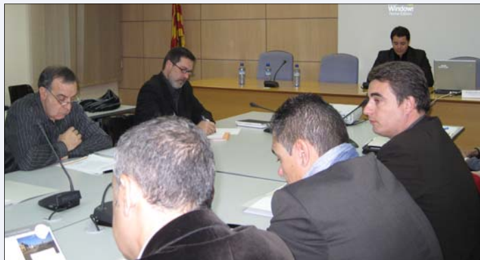
EL COMPROMÍS ES VA PRENDRE DURANT LA JORNADA DE MOBILITAT QUE VA TENIR LLOC EL PASSAT 23 DE NOVEMBRE A LA SEU DEL CONSELL COMARCAL

Ho fan sota el paraigua del Consorci Viari de Catalunya Central i a partir de l'anàlisi de la situació especialment complicada pel que fa a la mobilitat que pateixen els treballadors dels polígons de Santpedor i Sant Fruitós de Bages. En aquest àmbit, els serveis de transport públic no són adequats, i no hi ha massa alternatives al transport motoritzat, de manera