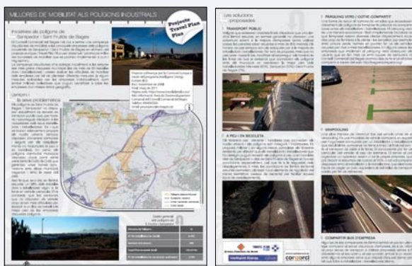
L'IMPRÉS DESCRIU LA INICIATIVA I PROPOSA SOLUCIONS DE MOBILITAT

tercer, fomentar la pràctica de compartir cotxe mitjançant, per exemple, iniciatives com el pàrquing verd (reserva de places per a les persones que comparteixen cotxe); quart, apostar pel 'vanpooling' (furgoneta compartida propietat de l'empresa o d'un operador, conduïda per un treballador); i cinquè, compartir autobús d'empresa per racionalitzar costos, contaminar menys i afavorir la mobilitat obligada dels treballadors d'empreses veïnes o d'un mateix àmbit geogràfic.