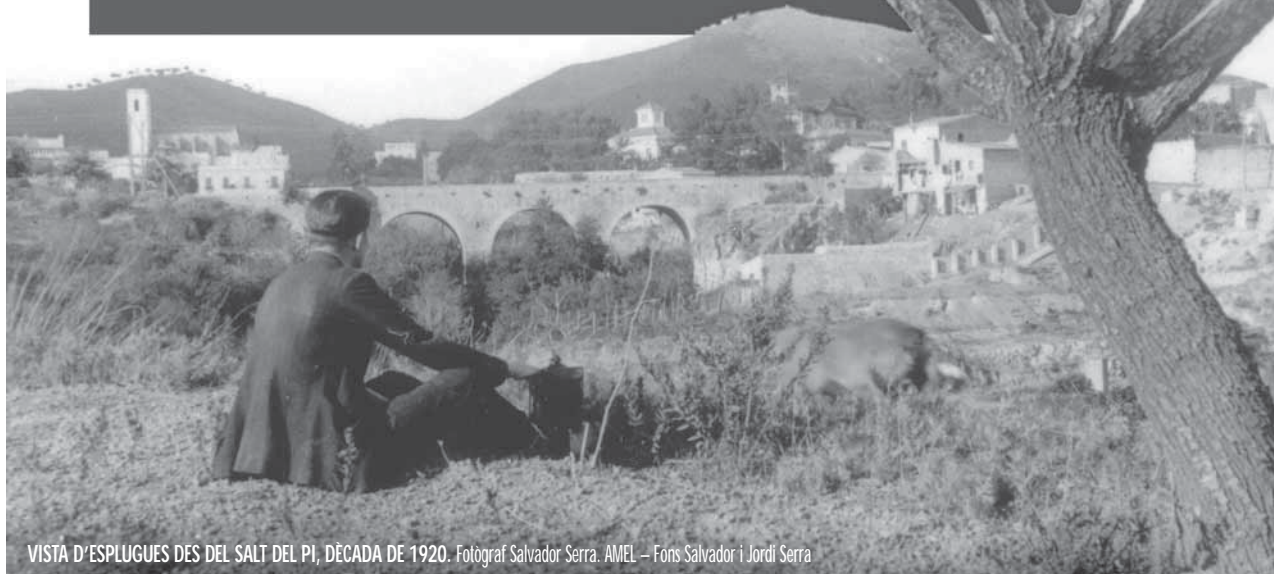
VISTA D'ESPLUGUES DES DEL SALT DEL PI, DÉCADA DE 1920.