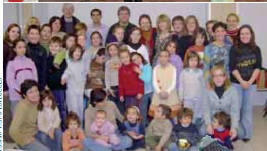
ESBART VILA D'ESPLUGUES