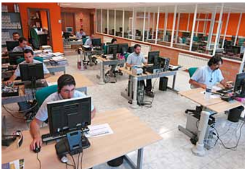
A dalt, el TPV tot en un HioPOS. A la dreta, ICGKiosk, el punt de venda desatès, i a l'esquerra una imatge dels departaments d'Innovació i Desenvolupament