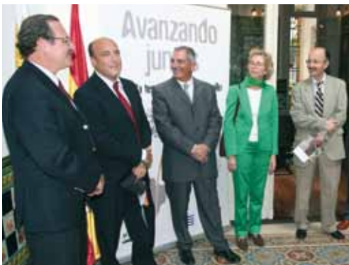
Acte d'inauguració d'ICG Uruguai, amb la presència del ministre d'Indústria del país, Daniel Martínez, l'Intendent Municipal de Montevideo, Ricardo Ehrlich i la representació de l'ambaixada espanyola a Uruguai