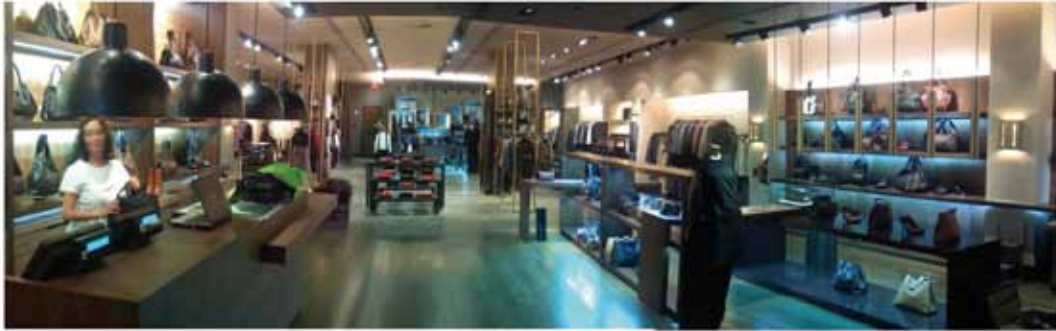
Les botigues d'Adolfo Domínguez a Miami, EEUU

Clients com ara les cadenes de botigues Adolfo Domínguez, Desigual, la naviera Baleària, Fira de Barcelona, El Poble Espanyol de Barcelona, Establiments Viena, Hotels Grup Abades i Citymar, The Singular Kitchen, Perfumeries Prieto, Antonio Puig, Establiments Viena, Cadena Bed's, Levi's Straus, Nike, Lacoste, Aramon, Boí Taüll, FC Barcelona, i la multinacional Àreas, que gestiona les principals autopistes dels Estats Units o establiments d'aeroports, o Eurest, que gestiona restaurants com el del Parlament de Catalunya o el del Banc Central de Portugal, entre milers d'establiments, utilitzen les solucions tecnològiques del Grup ICG.