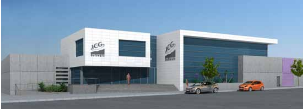
Imatge 3D de les noves instal·lacions que s'inauguren al desembre de 2010

El Grup ICG Software és una companyia catalana líder en la fabricació i comercialització de tecnologies de la informació d'alt nivell innovador que centra la seva activitat en el desenvolupament de solucions informàtiques de gestió empresarial.