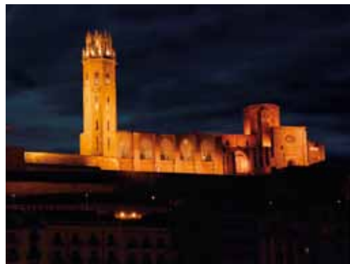
ICG Software es patrocinador oficial i soci tecnològic del Consorci del Turó de la Seu Vella de Lleida