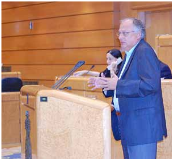
Jordi Guillot al Senat

E l portaveu adjunt de l'Entesa Catalana de Progrés i senador d'ICV, Jordi Guillot, president de la Comissió de Cooperació Internacional, va proposar als grups parlamentaris un text de declaració de suport a les mobilitzacions ciutadanes en diversos països del nord d'Àfrica i l'Orient Pròxim, així com el rebuig a les accions repressives i el suport als processos pacífics cap a règims democràtics.