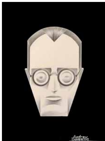
Reproducció de les caricatures de Dolores Ibarruri i Joan Comorera