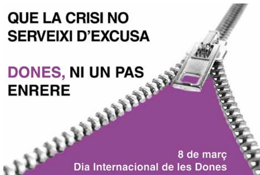
Imatge de la campanya del 8 de març editada per les dones de la coalició

garantir els avenços aconseguits en polítiques de gènere durant els 7 anys de