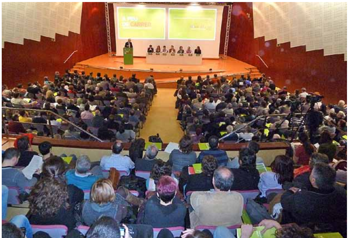
Imatge de la convenció, a la Universitat Politècnica de Barcelona

Finalment es van aprovar les 20 prioritats per a les eleccions municipals de la coalició ■