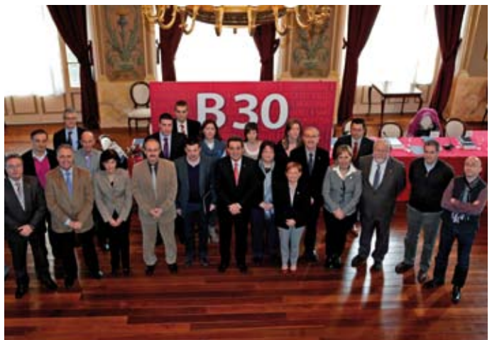
Els alcaldes i alcaldesses que van signar el manifest, el passat 31 de gener a Sabadell.

amb objectius com la creació d'ocupació, l'atracció i creació d'empreses i la promoció econòmica i comercial; i plataformes digitals de servei de promoció econòmica.