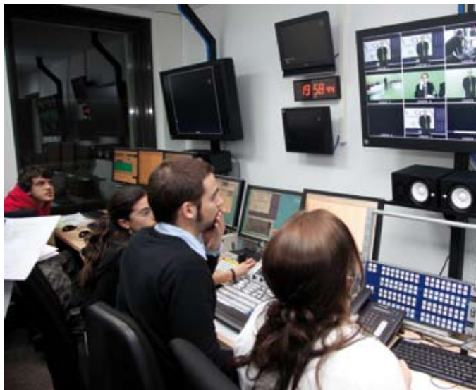
Sala de control de televisió, als estudis de Vallès Visió.

Aquestes xifres se sumen a les més de 200.000 visites que ja ha rebut el portal web de Vallès Visió. La mitjana de visites diàries és de 700, i és que www.vallesvisio.cat permet a l'usuari veure, en qualsevol moment i des de qualsevol lloc amb connexió a Internet, tots els programes i les notícies d'actualitat que emet el canal de TDT.