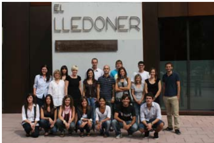
Tot l'equip de professionals de Vallès Visió.

Un 28% dels internautes que entren al web de Vallès Visió ho fan per veure algun dels quasi 2.000 vídeos que conté la pàgina. Un 23% entren per mirar algun programa concret. Un 14% ho fa a la recerca de l'actualitat d'algun municipi i un 10 % dels visitants cliquen l'opció de veure Vallès Visió en directe. Vallès Visió és l'única televisió d'àmbit comarcal que emet les 24 hores en directe a través d'Internet.