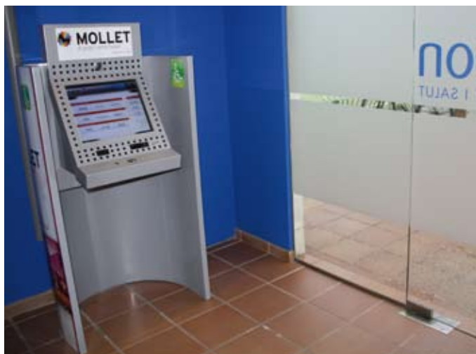
Un dels terminals està situat a l'entrada de Ca n'Arimon

Les oficines virtuals s'han instal·lat en equipaments públics situats en tres punts força allunyats de l'Ajuntament, ja que l'objectiu és apropar l'administració a la ciutadania i evitar llargs desplaçaments fins a l'edifici consistorial. Al mateix temps, aquestes oficines es poden utilitzar en horari molt