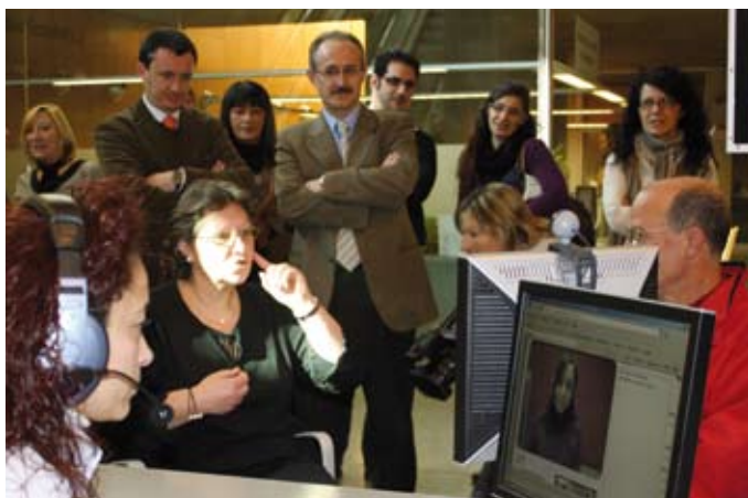
L'alcalde i el president de la Federació de Persones Sordes de Catalunya observen com funciona el nou sistema.

en tots els àmbits perquè Mollet es converteixi en una ciutat més accessible.