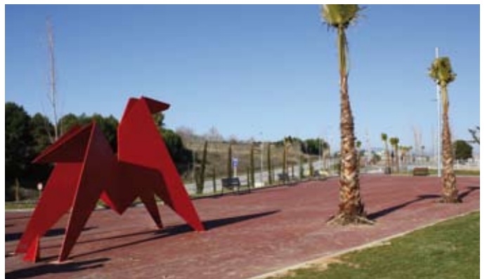
A dalt, imatge virtual del projecte de La Farinera. A baix espai urbanitzat del polígon.