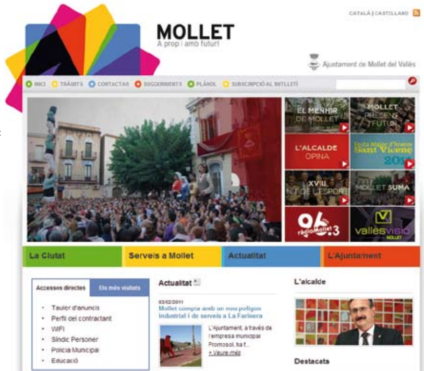
Imatge del nou web municipal

Si voleu rebre cada setmana informació d'allò que passa a Mollet, a través del nou web us podreu subscriure al