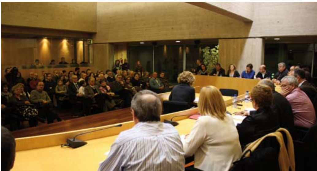
El Ple de l'Ajuntament votava l'atorgament de les distincions en presència de bona part de les persones reconegudes

Enguany, la Corporació Municipal ha aprovat atorgar les distincions cíviques "Per Mollet" a 24 molletans i molletanes i a 4 entitats. L'acte públic i solemne de lliurament tindrà lloc el 13 de març, a les 12 del migdia al Teatre Municipal Can Gomà.