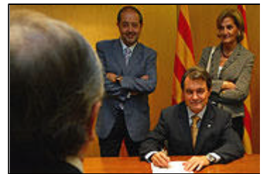
Contracte d'Artur Mas