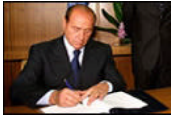
Contracte de Silvio Berlusconi

De fet la proposta de Mas de fer President el líder del partit amb més diputats faria de Berlusconi el President d'Itàlia i de Fraga el President de Galícia, doncs Forza Italia i el PP són els partits amb més diputats en els parlaments italià i gallec.