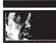
ALCALDE DE SANT CUGAT alcaldia@santcugat.cat

El veredict dels ciutadans ha estat contundent i la confiança que Artur Mas i CiU demanàvem l'hem obtinguda a les urnes. Els catalans han expressat el seu cansament cap el tripartit i han donat la ben-