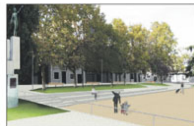
Imatge de la nova Plaça Sant Ramon

El nou projecte de Plaça Sant Ramon ja està en marxa. Les obres van començar a finals de febrer i es calcula que estiguin enllestides a finals de maig o principis de juny.