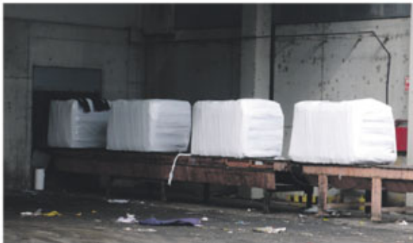
Bales de residus de l'Ecoparc II de Montcada

Per a prendre aquesta decisió hem visitat l'Ecoparc II de Montcada, hem copsat l'opinió dels veïns de Bellaterra i hem consultat a experts en les diferents matèries relacionades fins a obtenir el suficient grau d'informació i criteri que un tema de tanta importància