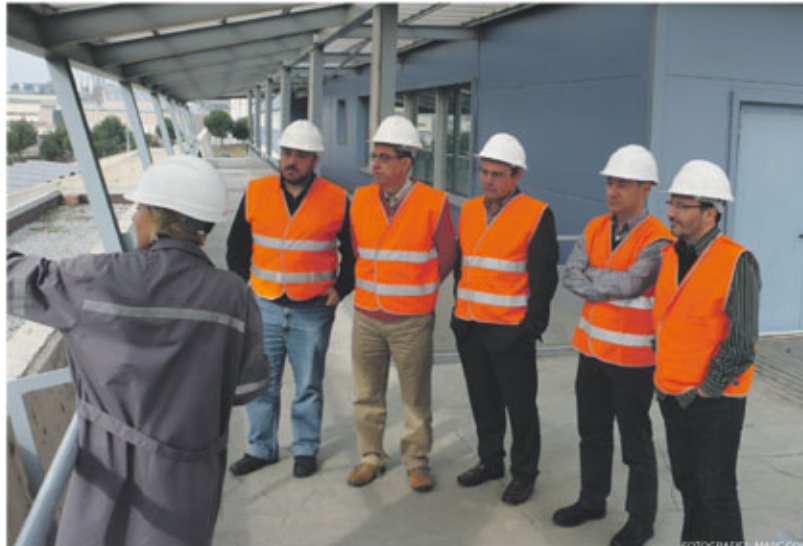
Una delegació de CiU Cerdanyola en una visita recent a l'abocador Ecoparc II de Montcada

Aquesta decisió és el resultat d'un intens treball dut a terme per la gent de CiU que, defugint de tota demagogia i oportunisme polític, hem pres de manera molt conscient i responsable pel bé de la nostra ciutat i de la gent de Bellaterra i el seu entorn.