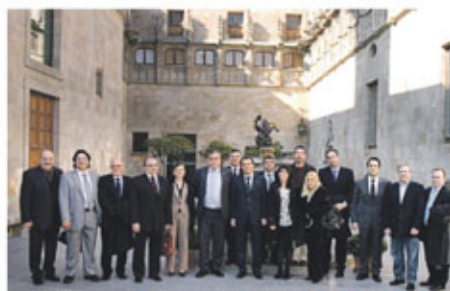
Fotografia de la delegació de la FIHR amb el president de la Generalitat, Artur Mas.

El president de la FIHR, Enric Gené, valora positivament la reunió perquè "ha permès traslladar al nostre president la realitat dels hostalers, el nostre complicat i difícil dia a dia". La crisi econòmica global i les darreres accions legislatives, com l'enduriment de la llei del tabac, han colpejat durament el sector. "Necessitem l'ajut de l'administració per referenciar. Som un sector estratègic de l'economia nacional i el país ens necessita forts, generadors de riquesa i ocupació". En aquest sentit Gené espera que les bones sensacions extretes de la trobada amb Mas es tradueixin en acords de col·laboració entre les parts.