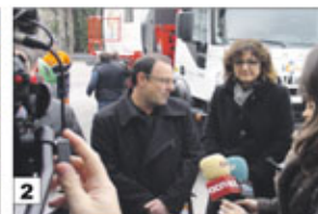
1. Festa ciutadana de la neteja a la Plaça Constitució. 2. Roda de Premsa d'Alfons Escoda presentant el nou sistema de neteja.

contenidor per la base, que suposa una reducció de l'embrutament dels mateixos i una reducció de la contaminació acústica en el buidatge. En segon lloc, pel que fa específicament els contenidors soterrats, se substitueix l'antic sistema d'elevació elèctrica per un de tracció manual, amb la qual cosa guanya en estalvi energètic, un estalvi que repercutirà en forma de la instal·lació de nous contenidors soterrats a nous punts de la ciutat. Finalment també s'incrementa un 40% la freqüència