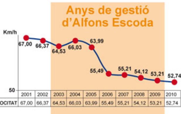
Gràfic que mostra l'evolució de la velocitat a la ciutat en els anys de gestió d'Alfons Escoda.

L'alta velocitat provocava sorolls molestos a tota hora del dia i la nit, a més de ser la màxima responsable dels accidents dins de la ciutat. Des de l'Àrea de Seguretat Ciutadana, es van començar a posar