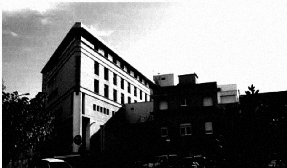
L'hospital comarcal de Palamós ■ AV.