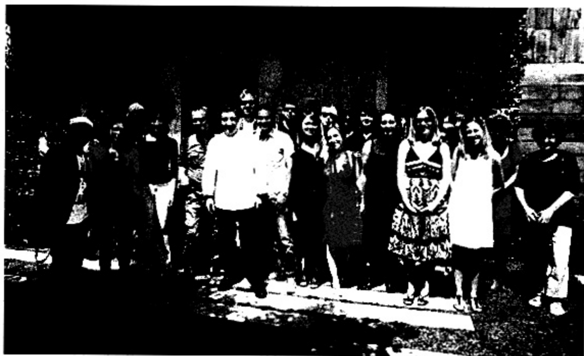
Els blocaires es van deixar fer una fotografia conjunta davant el celler de can Roca de Girona

I, de moment, ho estan aconseguint. Des de dimarts que van arribar a Lloret de Mar ja es poden veure diferents vídeos de la passejada en vaixell que van fer des de Palamós a Llafranc o de la baixada en paracaigudes que ahir es van atrevir a fer onze dels blocaires i que han penjat al Youtube. I ho va acabar de remar amb un dinar al Celler de Can Roca: “El cel és igual al Celler de Can Roca”, va penjar al Twitter Keith Jenkins, amb 25.000 seguidors a aquesta xarxa social o: “Això és una experiència gastronòmica de prime-