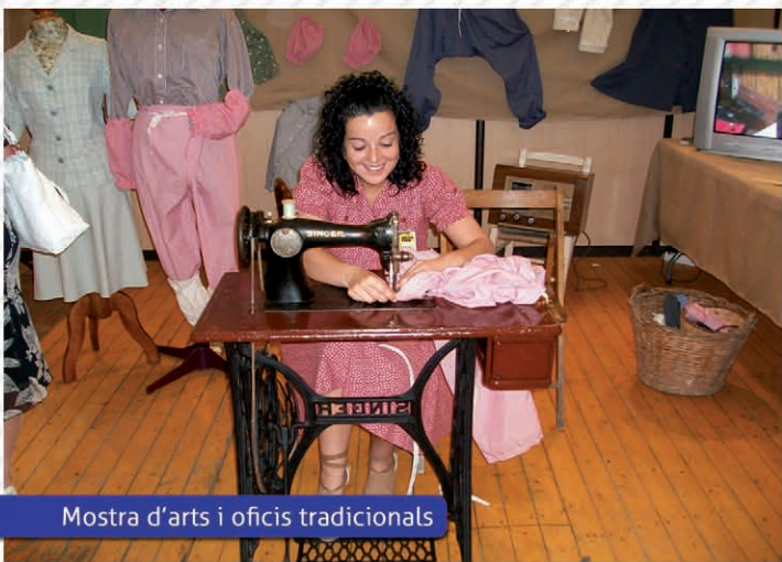
Mostra d'arts i oficis tradicionals