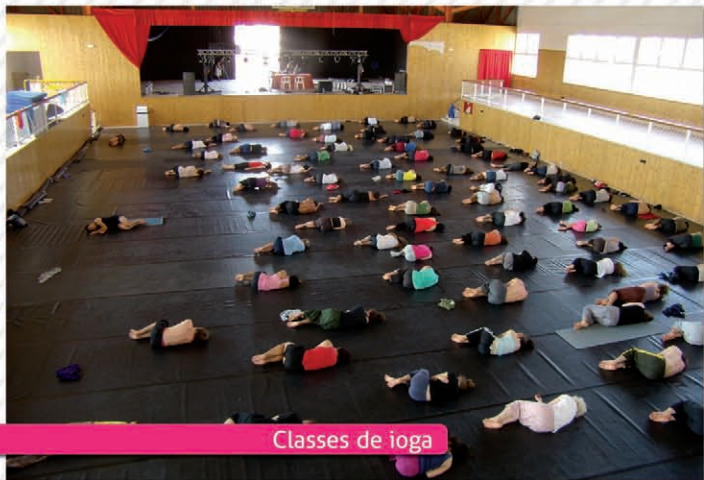
Classes de ioga

a més de cedir les instal·lacions i el suport logístic de la brigada. Cada alumne ha de pagar també una matrícula d'inscripció de 500€ per rebre les classes, l'allotjament i el menjar (que prepara l'organització a través d'un servei de càtering).