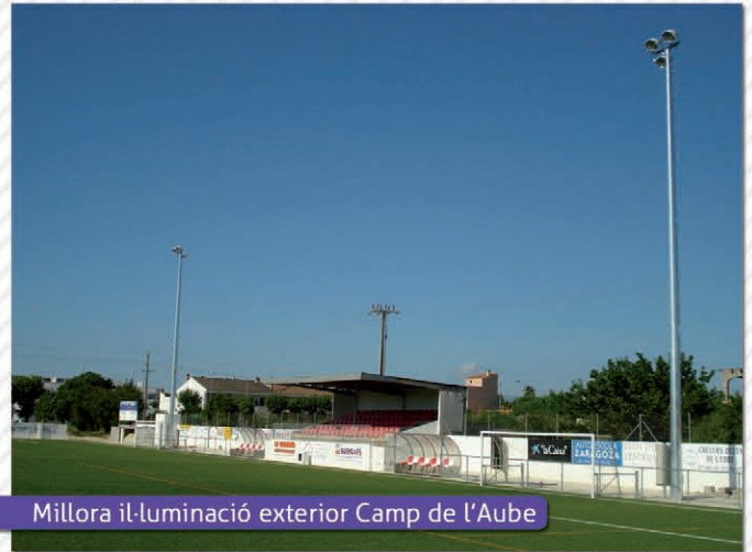
Millora il·luminació exterior Camp de l'Aube