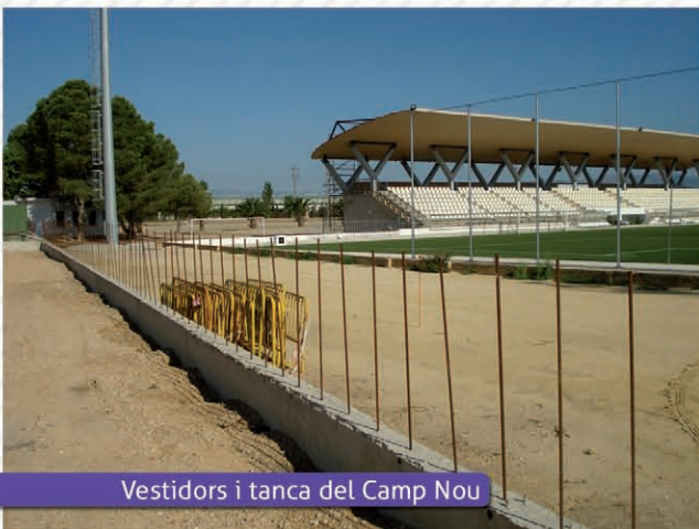
Vestidors i tanca del Camp Nou