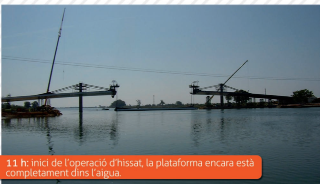
11 h: inici de l'operació d'hissat, la plataforma encara està completament dins l'aigua.

L'estructura del nou pont entre Deltebre i Sant Jaume d'Enveja ja creua el riu Ebre de banda a banda després que el passat 30 de juny, es duguessin a terme els treballs de col·locació de la peça central del tauler del pont. Va ser una operació molt complexa que va començar de matinada amb el trasllat de la peça per flotació fins al punt on s'havia de fer l'operació d'hissat (foto 1). L'elevació de la peça central del pont, de 63 metres de llargada i 530 tones de pes, es va fer mitjançant gats col·locats als dos extrems del pont i es va allargar prop de 5 hores (foto 2). Un cop la peça va arribar al seu lloc van començar els treballs per soldar el tram central als dos laterals i iniciar la fase de tensat del cablejat del pont (foto3).