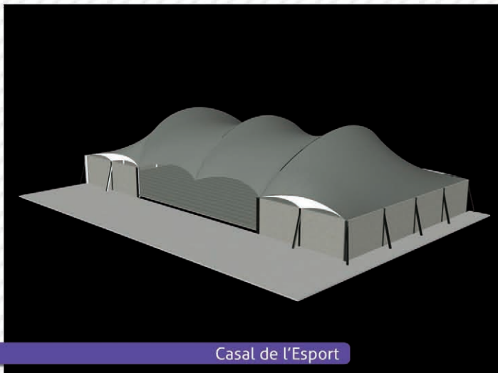
Casal de l'Esport

amb un pressupost de 497.715,95 €. Aquest equipament esportiu tindrà un doble funció com a gimnàs del CEIP Sant Miquel i estarà obert a la pràctica esportiva de les entitats, associacions i clubs esportius de Deltebre. Aquesta sala esportiva es construirà al carrer Lluís Companys, darrera de les instal·lacions del CEIP Sant Miquel, serà un equipament de prop de 1.245 metres quadrats i estarà dotat amb una coberta tenso estàtica.