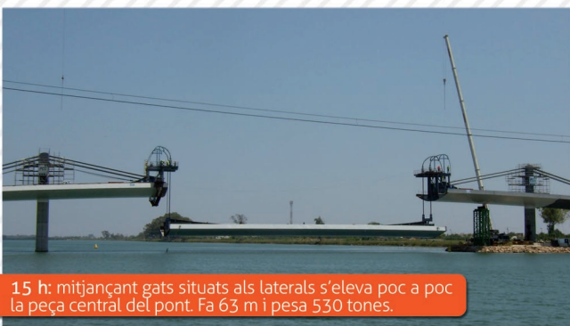
15 h: mitjançant gats situats als laterals s'eleva poc a poc la peça central del pont. Fa 63 m i pesa 530 tones.