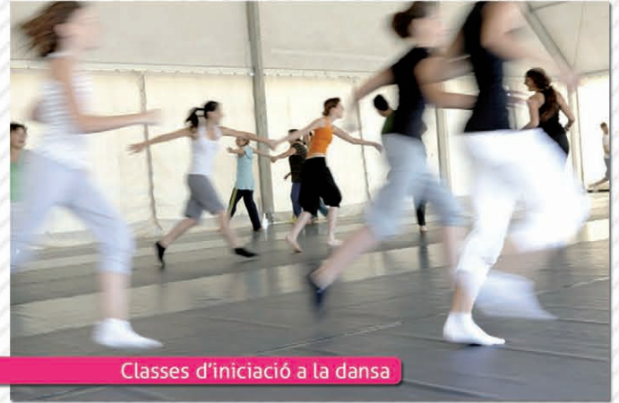
Classes d'iniciació a la dansa

Paral·lelament al ressò internacional que any rera any adquireix el Taller de Dansa, des de l'Àrea de Cultura de l'Ajuntament es fa també un esforç per aconseguir una major implicació i participació de la ciutadania en el projecte. Enguany prop d'un centenar d'alumnes han participat en els cursos de dansa que s'han organitzat oberts a la ciutadania. Al curs d'Iniciació a la Dansa Contemporània van inscriure's 51 alumnes i 37 més al d'introducció al Breakdance. Tot un èxit.