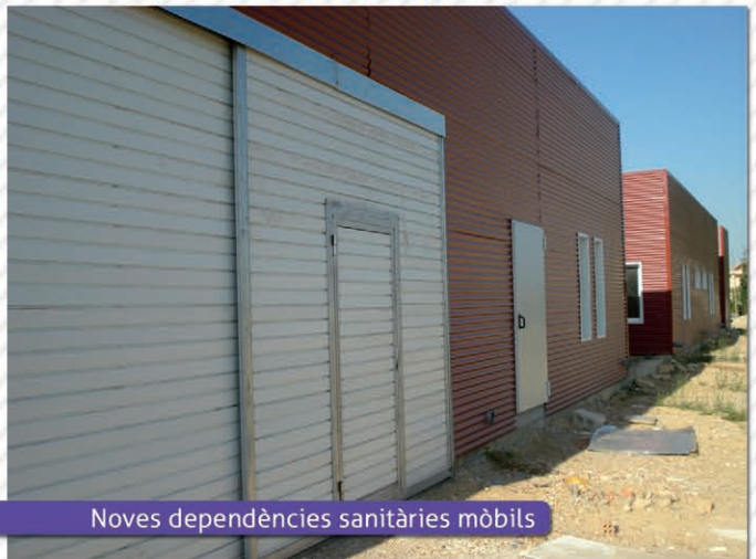
Noves dependències sanitàries mòbils