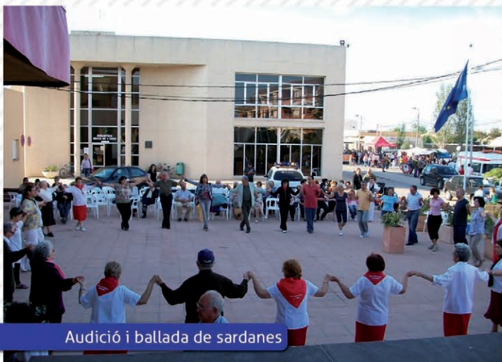
Audició i ballada de sardanes