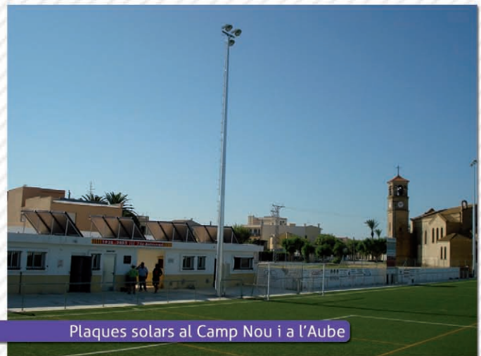
Plaques solars al Camp Nou i a l'Aube