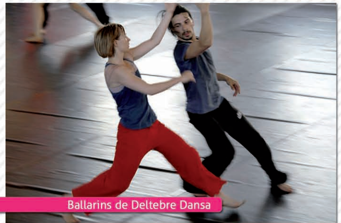
Ballarins de Deltebre Dansa

Tenir a Deltebre aquest Taller de Dansa implica una important promoció turística, ja que cada any 160 persones d'arreu del món visiten el nostre poble i són usuaris dels nostres serveis turístics, a més el nom de Deltebre és conegut a molts països on hi ha escoles de dansa. També cal tenir en compte la repercussió mediàtica i a internet que té el taller de Dansa amb centenars de seguidors al perfil del Facebook i, a més, molts mitjans de prestigi del país se n'han fet ressò. Per últim cal destacar l'aportació cultural del Taller de Dansa al poble de Deltebre, amb classes d'iniciació a la dansa, concerts i espectacles gratuïts de diferents disciplines artístiques. Tot un luxe.