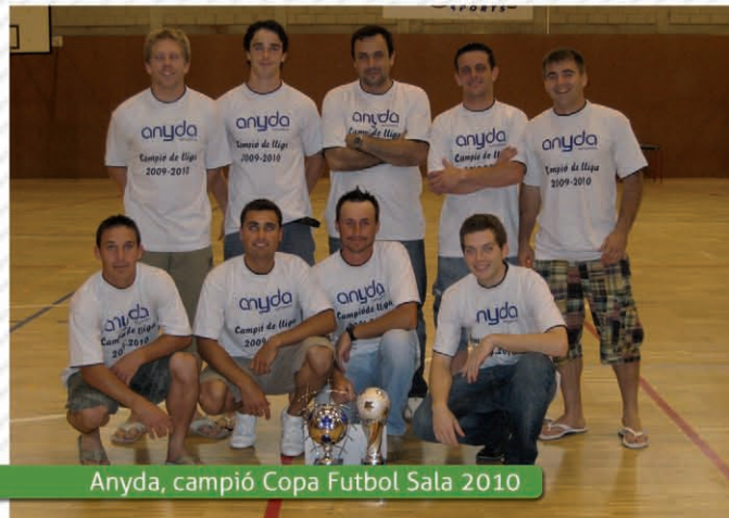
Anyda, campió Copa Futbol Sala 2010