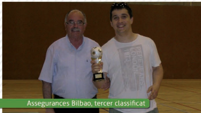
Assegurances Bilbao, tercer classificat