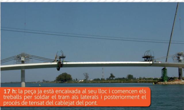
17 h: la peça ja està encaixada al seu lloc i comencen els treballs per soldar el tram als laterals i posteriorment el procés de tensat del cablejat del pont.