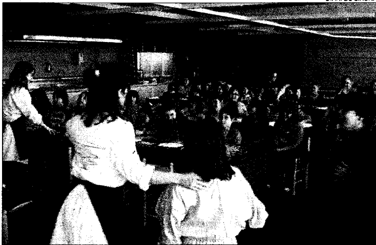
Un dels tallers realitzats la setmana passada a l'Espai del Peix.

Aquest taller, totalment gratuït, té com a objectiu sensibilitzar els joves escolars de la importància de portar una vida saludable, mostrant-los senzilles pautes per fer