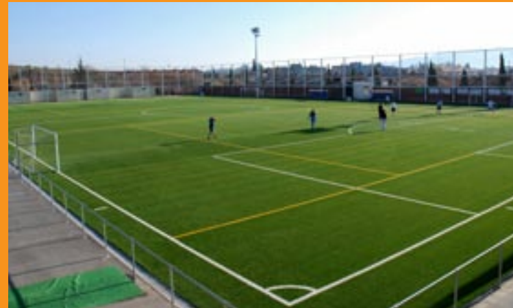
CAMP DE FUTBOL