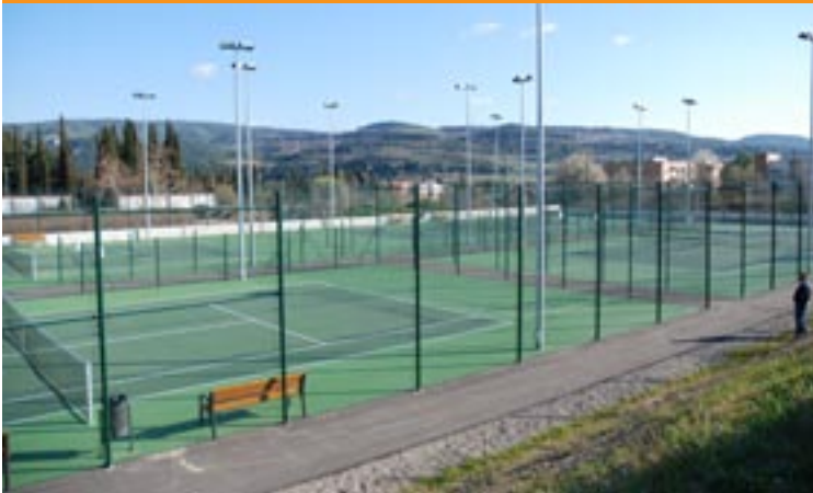
PISTES DE TENNIS