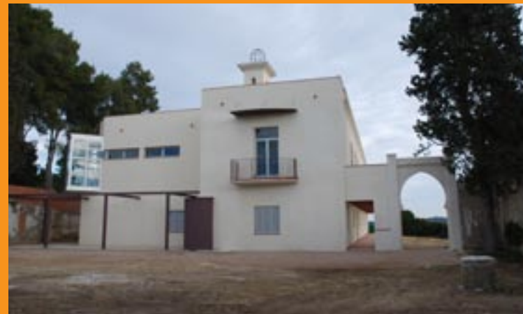
CAN FERRER DEL MAS