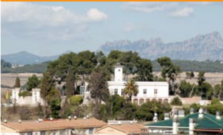
VISTA GENERAL DE CAN FERRER DEL MAS