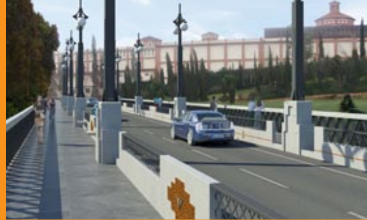
PROJECTE DEL PONT DE L'ESTACIÓ