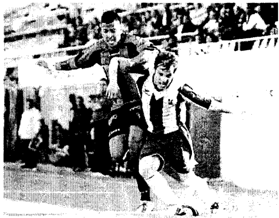
Vichu lluita per una pilota amb un jugador del Reus, ahir. J.R.

En la segona part el Palamós va tenir els millors moments de futbol, però les ocasions més clares van ser per al Reus. Robert en el 75' va tenir una doble ocasió i en el 76' un intent de refús de Micaló amb el cap va acabar amb la pilota al travessar de Bayona. El Palamós va tenir la sort que de vegades li ha faltat.