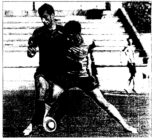
El Palamós no va poder passar de l'empat a casa contra el Reus.