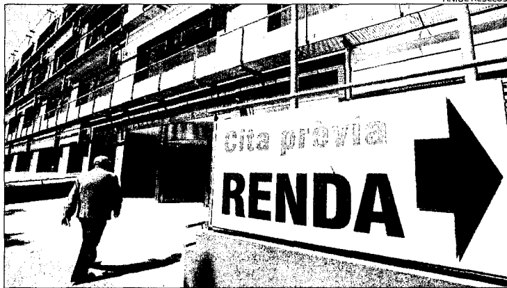
Oficines de l'Agència Tributària a la ciutat de Girona

Des que va començar la campanya el 4 d'abril (amb dades fins al 2 de maig), ja han sol·licitat l'esborrany de la Renda per a consulta en línia -novetat d'aquest any- 546.307 contribuents cata-