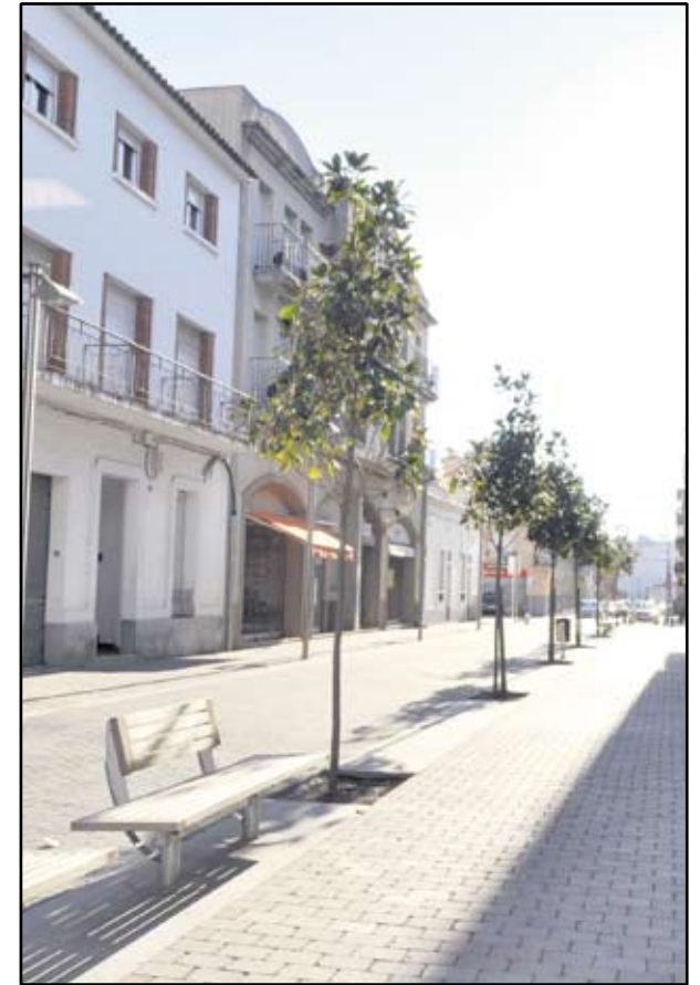
LA VIANALITZACIÓ DELS NUCLIS ÉS UNA APOSTA PER LES PERSONES, PER LA DINAMITZACIÓ I LA SOCIALITZACIÓ.

Descripció: Establir un calendari de Fires i Mostres d'Art permanents al carrer i en espais culturals locals. Potenciar artistes locals i la promoció d'intercanvis. Ampliant l'oferta tant econòmica com cultural. I establir de forma permanent un mercat d'intercanvi i de segona mà.