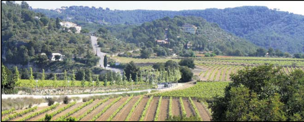
LES URBANITZACIONS, COM CAN LLOSES, CAN PERE DE LA PLANA... SÓN TERRITORI.

Objectiu: Davant dels nous canvis i de les transformacions necessàries, cal un nou planejament urbanístic que permeti avançar en sostenibilitat, habitatge, equitat territorial, desenvolupament econòmic i social, sostre de creixement, protecció del paisatge, mobilitat i comunicacions.