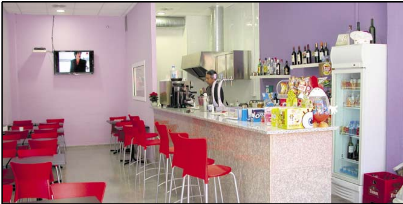
EL NOU BAR DEL CENTRE CÍVIC ÉS UNA MILLORA EN SERVEIS I UN IMPULS ECONÒMIC AL MATEIX TEMPS.

Descripción: Aportar a la planificación del mantenimiento y mejora del espacio público, la implicación y participación ciudadana. Permitir una mayor coordinación a través de una comunicación directa entre los sectores, barrios y plazas y calles con el Ayuntamiento. Un Ayuntamiento de las personas.