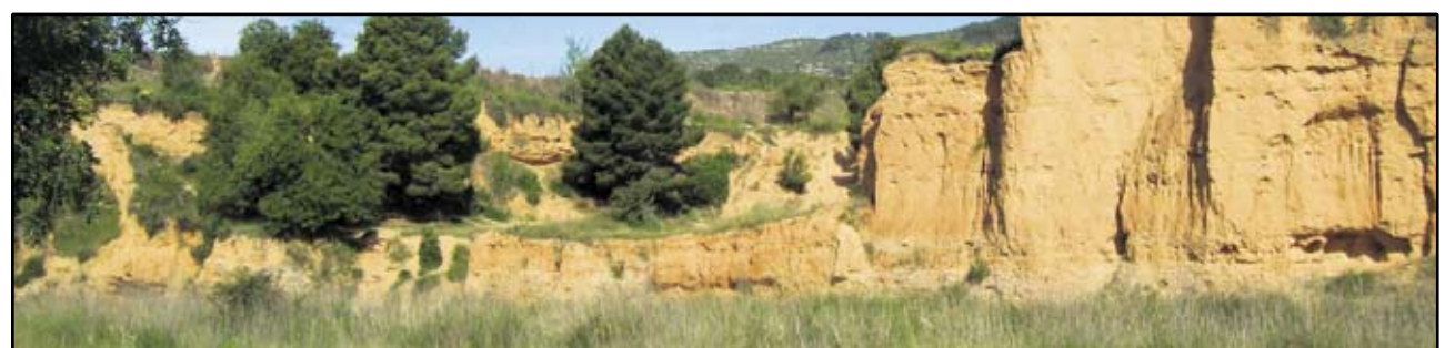
AMB NOSALTRES, EL MUNICIPI HA FORMAT PART DEL CONSORCI DELS COLLS-MIRALPEIX, EL QUÈ HA PERMÉS TREBALLAR EN XARXA EL PLA DE CAMINS DELS COLLS I EL PLA ESPECIAL DE LA RIERA DE RIBES, PER EXEMPLE.

Descripció: Establir un calendari d'establiment de la Deixalleria Mòbil en punts concrets, als nuclis de Ribes i Les Roquetes els dies de