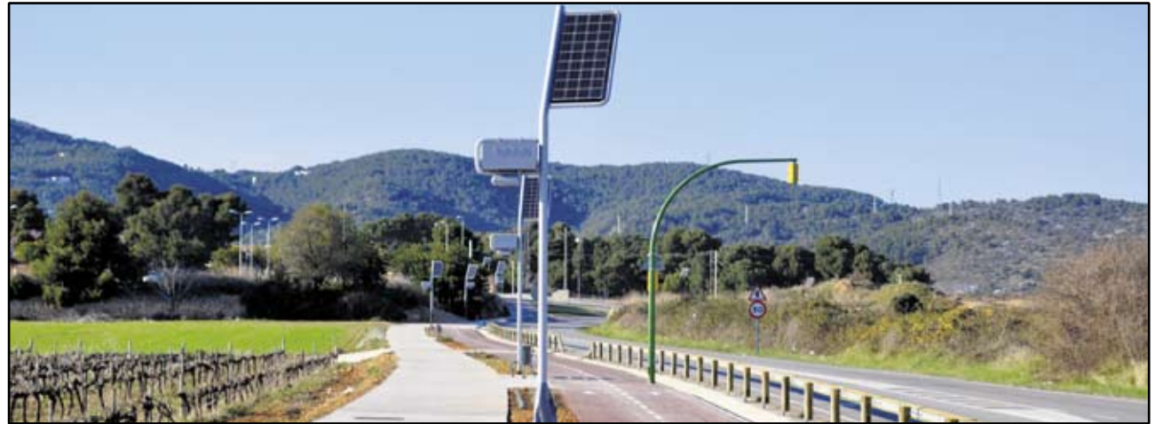
AMB ELS FANALS FOTOVOLTAICS, ICV-EUIA HA IMPULSAT UN PAS ENDAVANT EN L'AUTOSUFICIÈNCIA ENERGÈTICA. UN COMPROMÍS QUE JA TÉ UN INICI I CAL CONSOLIDAR.

Descripció: Aquest ha estat un projecte de gran magnitud impulsat amb la participació de Sant Pere de Ribes al Consorci dels Colls Miralpeix i conjuntament amb Sitges. Es tracta d'un Pla de regulació i protecció de la Riera des de les Parellades a la desembocadura. Un instrument de planificació que ens ha de permetre protegir un entorn de gran interès natural i històric, que engloba espais singulars d'interès paisatgístic i ambiental però també cultural i social. El Pla a més, ens ha de permetre l'execució de la intervenció necessària per a fer pedalable i transitable el seu trajecte.