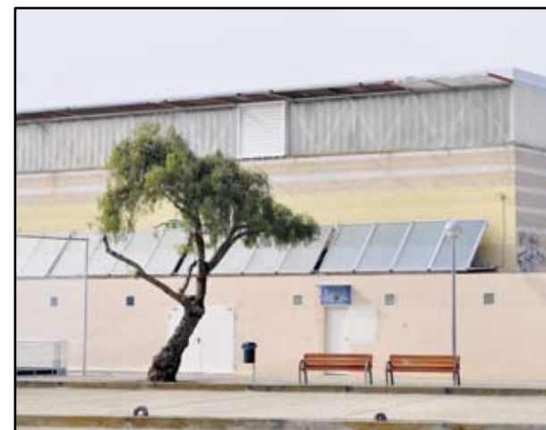
LES PLAQUES SOLARS INSTAL·LADES ALS PAVELLONS SÓN UNA APOSTA FERMA PER UNA EFICIÈNCIA ENERGÈTICA

Descripción: Potenciar un parque de viviendas digno y adaptado a las nuevas necesidades, accesibilidad y energías renovables. Fomentar la conservación para la inclusión de más vivienda de alquiler asequible y activación del sector económico.