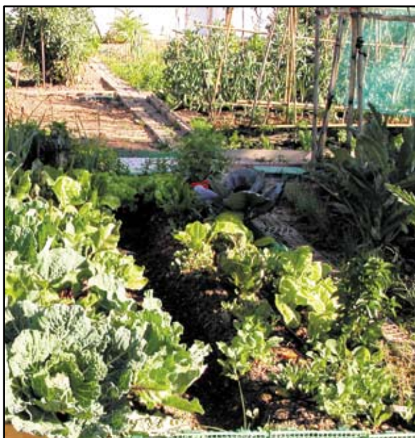
ELS HORTS ECOLOGICS URBANS SÓN L'EXEMPLE DE LA SINÈRGIA ENTRE CULTURA I NATURA, UN ESPAI PÚBLIC DE RELACIÓ ENTRE LES PERSONES I LA TERRA.

Descripción: Es necesaria una planificación de la instalación progresiva de este sistema ecológico de obtención de energía en los equipamientos municipales y hacer extensivo su uso a particulares facilitando las herramientas y / o recursos. Con esta acción, también, fomentamos la creación de nuevos puestos de trabajo local, y es una de las acciones contempladas en el Plan de Mitigación y Adaptación al Cambio Climático aprobado ya en este año 2011 y que tiene como objetivo llegar al 2020 con una reducción del 20% de las emisiones de CO2 en nuestro municipio, un objetivo que hay que asumir con responsabilidad y compromiso.