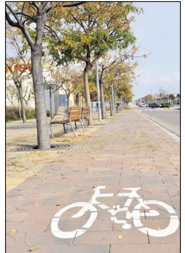
AMB EL TERCER TRAM DE LA RAMBLA DEL GARRAF I EL CARRILBICI DE PUIGMOLTÓ, HEM AVANÇAT EN MOBILITAT I INTERCONNEXIÓ TERRITORIAL.

Descripción: Dotar de personal propio a la organización dependiente de la administración y favorecer así la coordinación y ejecución de proyectos. GPM debe ser una herramienta de potenciación del acceso a una vivienda digna, y debe participar de la ejecución de los objetivos del Plan local de vivienda que establece un objetivo claro de parque de viviendas de protección oficial para el 2014