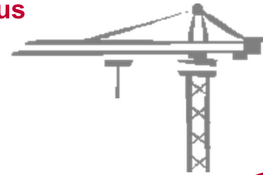
Escola LA CARPA