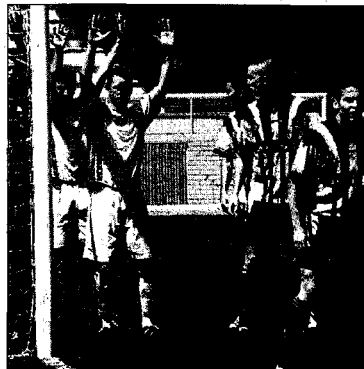
El Palamós jugará en Catalana F.: CF PALAMÓS