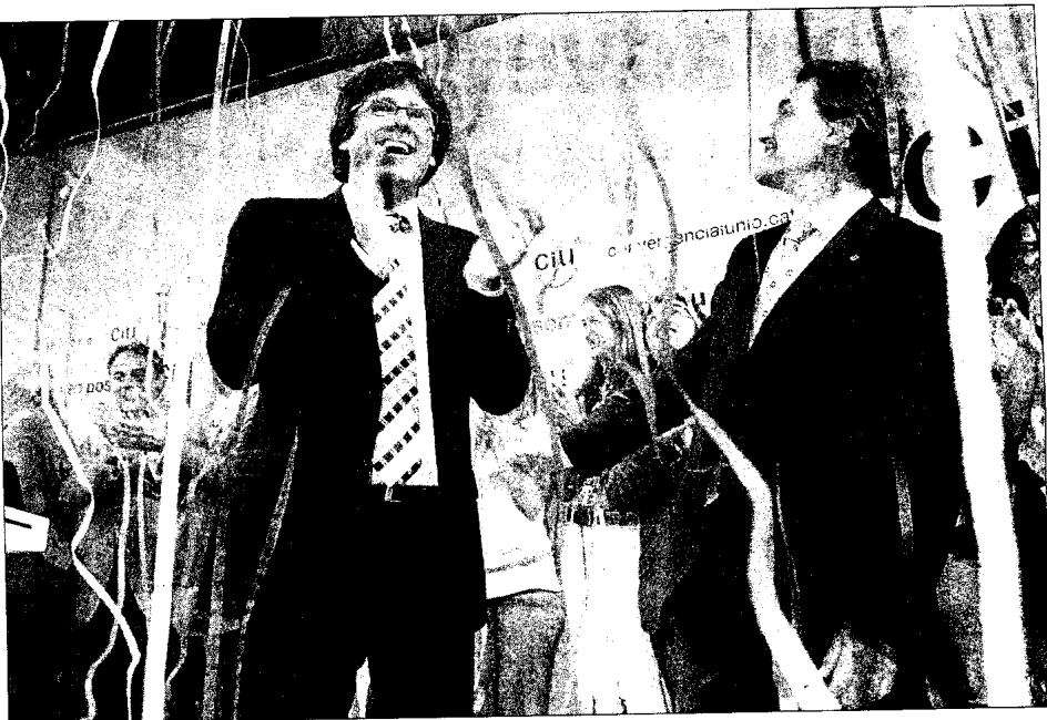
Artur Mas i Carles Puigdemont, candidat de CiU a Girona, ahir a l'auditori de la ciutat