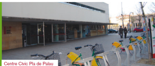
Centre Cívic Pla de Palau