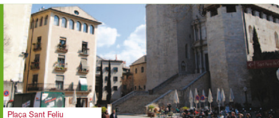
Plaça Sant Feliu