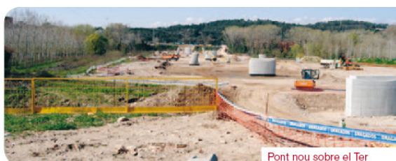
Pont nou sobre el Ter