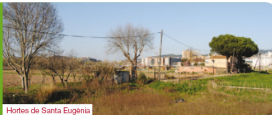
Hortes de Santa Eugènia