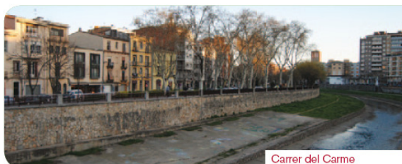
Carrer del Carme