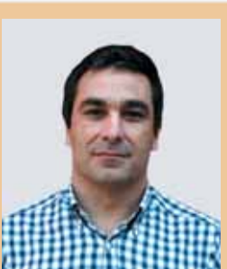
Josep Sales i Ortega Centre