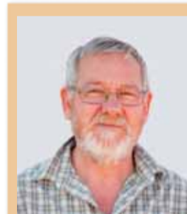
Pepe Ruiz i Rodríguez Centre - (Acord x T.)

“Donarem un suport especial a les entitats que, per la seva ubicació o especificitat, treballen per combatre les desigualtats socials”