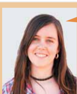
Mireia Bercial i Parellada Centre

"Hem de millorar la coordinació entre les actuacions realitzades pels proveïdors de serveis de salut al territori i les que es realitzen des de l'ajuntament per tal d'incrementar-ne l'impacte, es tracta de donar un gran pas endavant en termes de prevenció i detecció precoç."