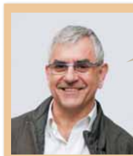
Jesús Viñas i Cirera Centre

“Cal vetllar per a la igualtat d'accés de tots els ciutadans i ciutadanes a un servei públic d'educació de qualitat i gratuït”.