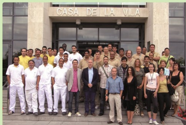
Plans extraordinaris d'Ocupació