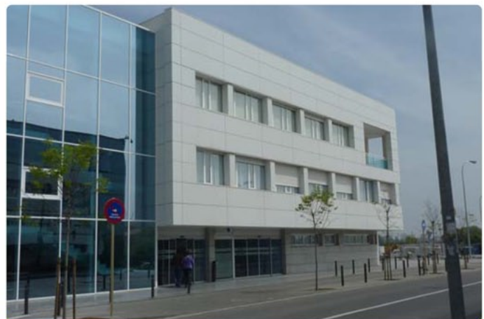
Hospital Lleuger de Cambrils