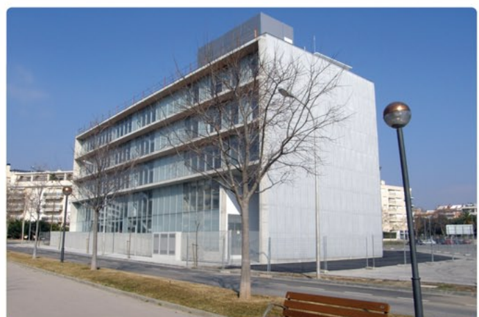
Ateneu juvenil i Centre de Formació Municipal