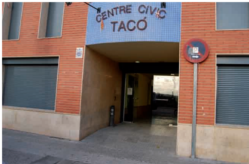
El Centre del Tacó va ser el lloc escollit per la xerrada amb els veïns

La candidata i regidors de CiU coneixen de primera mà la realitat dels barris