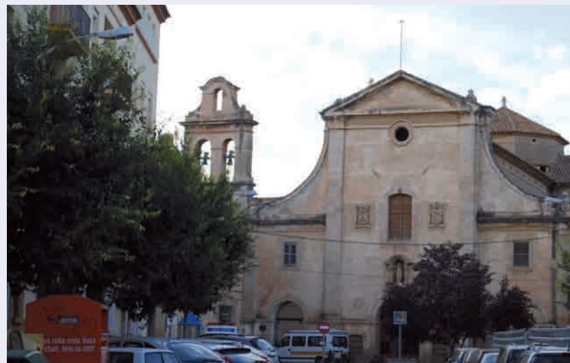
Encara estem esperant la promesa de l'alcalde del nou hospital

El PSC-PSOE, sap que tindrà al seu costat a CiU per tal de donar suport a totes les iniciatives que en l'àmbit de la salut millorin la qualitat de vida dels nostres ciutadans. Ja no és el moment d'espera, ara cal trobar solucions definitives pel sistema de salut a la nostra comarca, nosaltres estem disposats a afrontar el repte, ho farà qui governa?