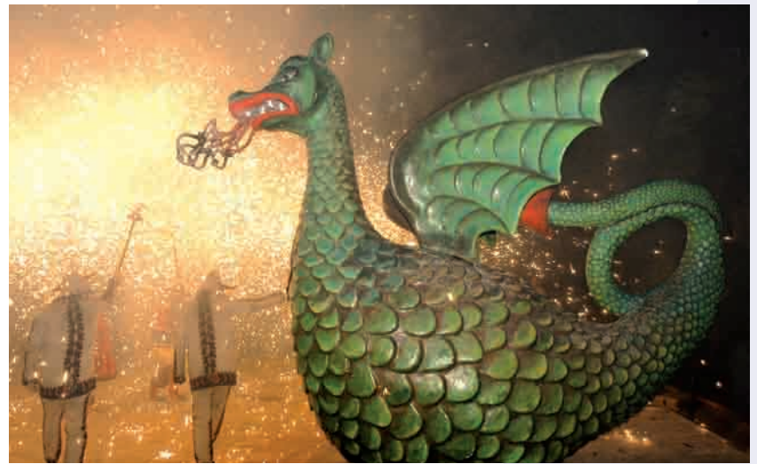
El drac i els diables de Vilanova en un moment de la Festa Major

Cal una reflexió a fons sobre l'estat de la cultura a Vilanova i la Geltrú que apunti unes direccions estratègiques a seguir en la que hauran de ser-hi participants tots els agents implicats en la producció de la cultura i, com no, la societat civil. Nodrir-nos d'altres experiències similars d'arreu del territori nacional i internacional poden ser claus