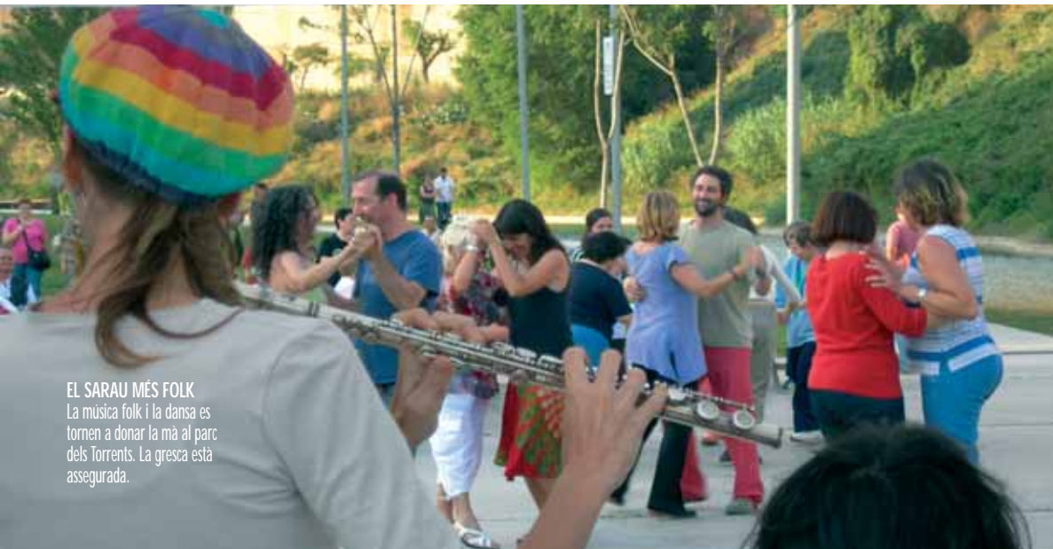
EL SARAU MÉS FOLK La música folk i la dansa es tornen a donar la mà al parc dels Torrents. La gresca està assegurada.