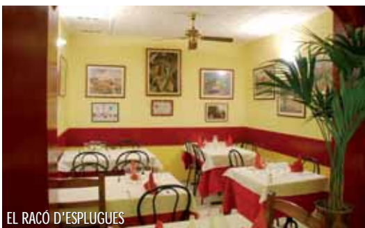
EL RACÓ D'ESPLUGUES

Un espai agradable i càlid, decorat amb pintures del Pirineu de Lleida, tret del racó d'Esplugues, on es poden apreciar aquarel·les de Domingo Rubies, pintor espluguenc que va plasmar les masies de la ciutat. El Restaurant Mendía, un antic magatzem de galetes, va obrir les seves portes un 17 de maig de 1995, i és, per a molts, un dels millors restaurants de la ciutat.