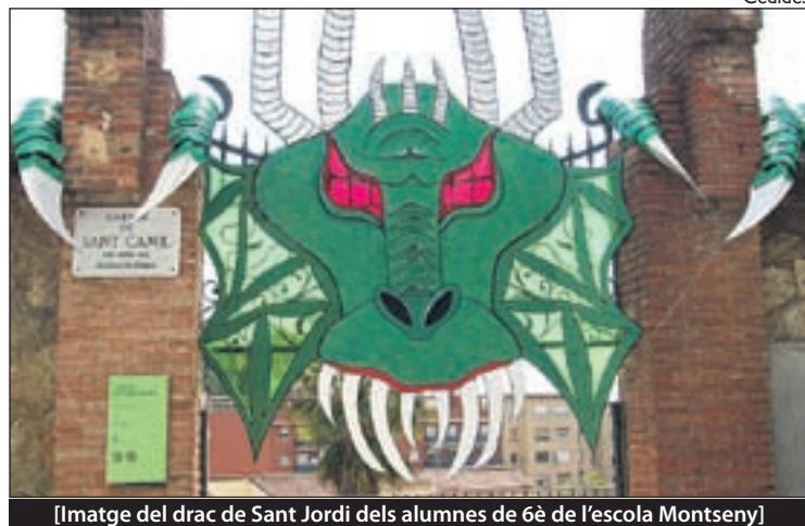
[Imatge del drac de Sant Jordi dels alumnes de 6è de l'escola Montseny]

Materials utilitzat: Cartró reciclat (d'una nevera), plàstic de seguretat amb bombolletes reciclat (embolcall d'un aparell nou), paper transparent vermell i verd, tub corrugat de 2,5 polses de diàmetre (d'extractor de cuina), pintura verda i negra, pegament fort.