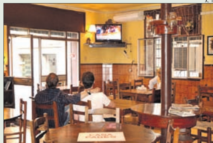
LA CASA PAGÉS ÉS UN DELS LOCALS ADHERITS A LA INICIATIVA

cal connectar-se a la pàgina web www.sportandbar.es o des de l'aplicació mòbil per saber el bar més proper on poder gaudir del teu esport preferit. Els locals adherits tenen accés a un compte al web i van actualitzant la seva programació esportiva cada dia per garantir la seva retransmissió als clients. Alhora els usuaris també poden registrar-se i crear un perfil personalitzat que els anunciï la retransmissió dels seus esports preferits, participar en els fòrums i crear grups d'amics per anar veure els partits