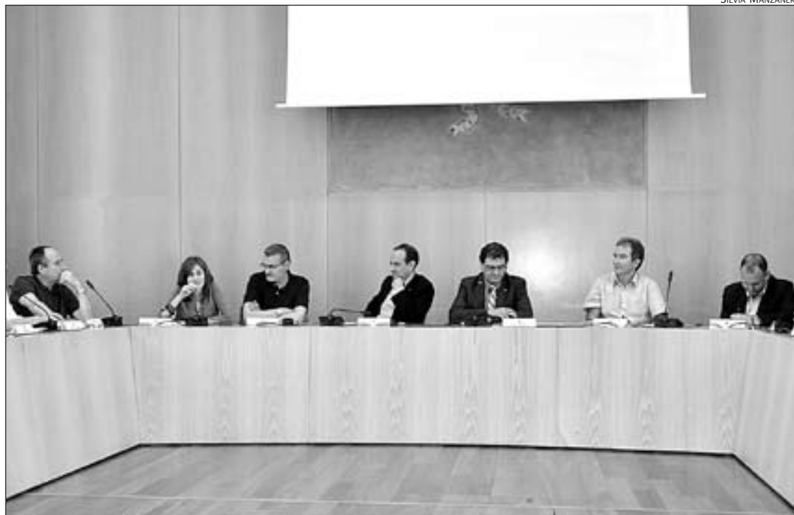
IMATGE DEL DARRER PLE DE LA LEGISLATURA CELEBRAT LA SETMANA PASSADA