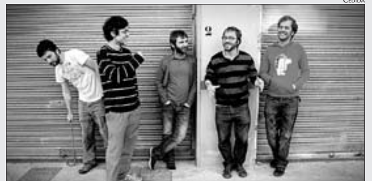
ELS COMPONENTS DEL GRUP MALLORQUÍ OLIVA TRENCADA

Aquí no som músics. Ens coneixen però no ens tracten com a professionals. Els de veritat són els