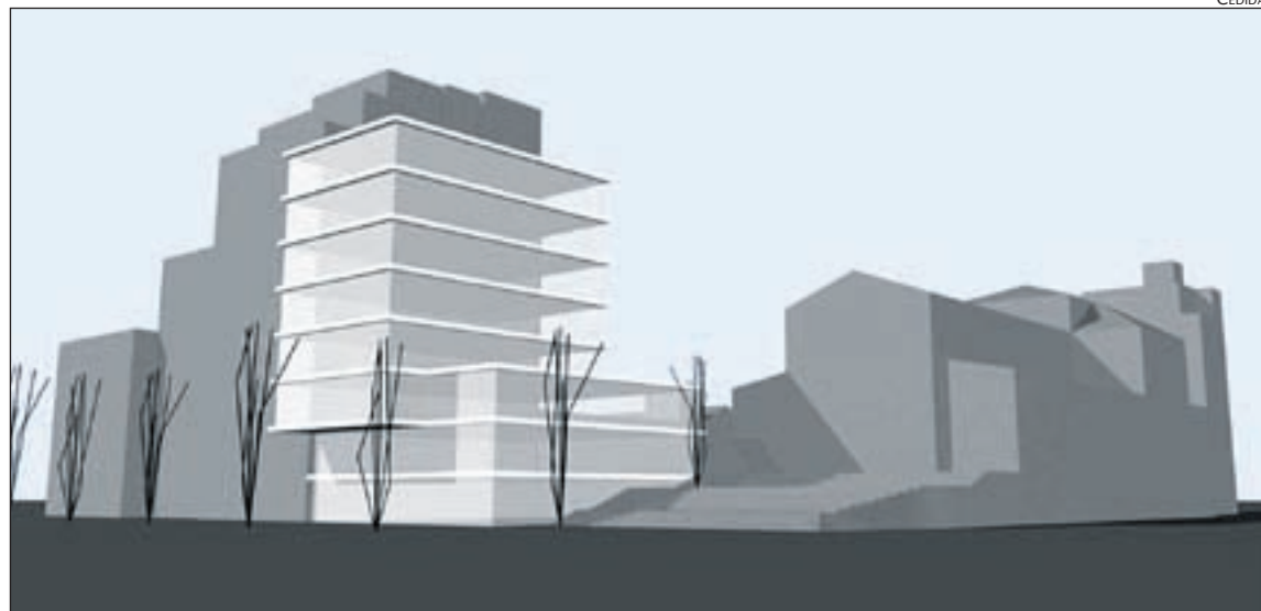
IMATGE VIRTUAL DEL PROJECTE ARQUITECTÒNIC DE LA PLAÇA LESSEPS PRESENTAT PELS VEÏNS

La fesomia de la zona nord de la plaça Lesseps, que només parcialment és Gràcia, ha sofert un canvi des de fa uns dies: l'Ajuntament ha tirat a terra l'edifici municipal adosat a l'església dels Josepets, que presentava un aspecte molt malmès, per qüestions de seguretat i higiene. Però la lectura que en fa l'Associació de Veïns i Comerciants de la plaça és que això dona més possibilitats a la proposta arquitectònica molt elaborada —que ja ha presentat als Districtes de Gràcia i Sarrià-Sant Gervasi— per construir un centre de barri per als dos districtes. Els veïns sostenen que el centre cívic més proper és la Sedeta o Cardener i el compromís en campanya de Xavier Trias a favor de la idea ha donat ànims. El lloc elegit són tres parcel·les a l'esquerra (cantó Llobregat) dels Josepets: els números 25 i 26 de