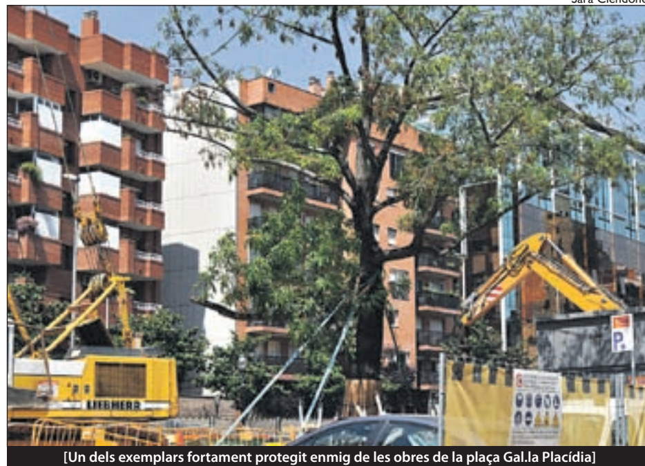
[Un dels exemplars fortament protegit enmig de les obres de la plaça Gal·la Placídia]

A mitjan del passat mes de gener van començar les ocupacions i els transplaments d'arbres a la plaça de Gal·la Placídia per tal de construir una subestació de FGC en aquesta zona. Aquestes obres han de servir per desviar serveis