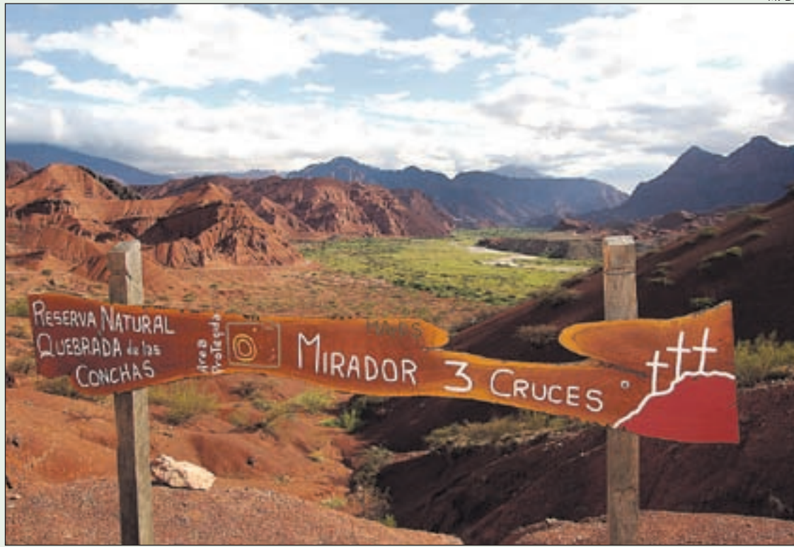
MIRADOR DE LAS TRES CRUCES

Cafayate és una de les regions vitivinícoles per excel·lència de l'Argentina. Envoltada de grans extensions de vinyes, és conscient que un dels principals atractius per als visitants és la ruta per les seves bodegues de renom, entre elles Etchart, Vasija Secreta, Domingo Hermanos i Nanni. Els autòctons lamenten el creixement experimentat en els darrers anys, fruit d'un interès i una inversió estrangera a la zona, i recorden els temps en què Cafayate era una ciutat tranquil·la i gairebé despoblada. També es remunten, amb certa sensació d'impotència, als temps en què per a ells encara era possible adquirir un terreny, "abans que els ianquis i els europeus es fessin amb el negoci de les collites". La carretera que connecta per l'est Cafayate amb Salta travessa l'anomenada Quebrada de las Conchas, un dels paisatges més impactants de l'Argentina. Al llarg d'aquest recorregut els ulls es delecten amb una sèrie de formacions naturals que un ha de trepitjar o tocar per acabar de creure que són reals. Al