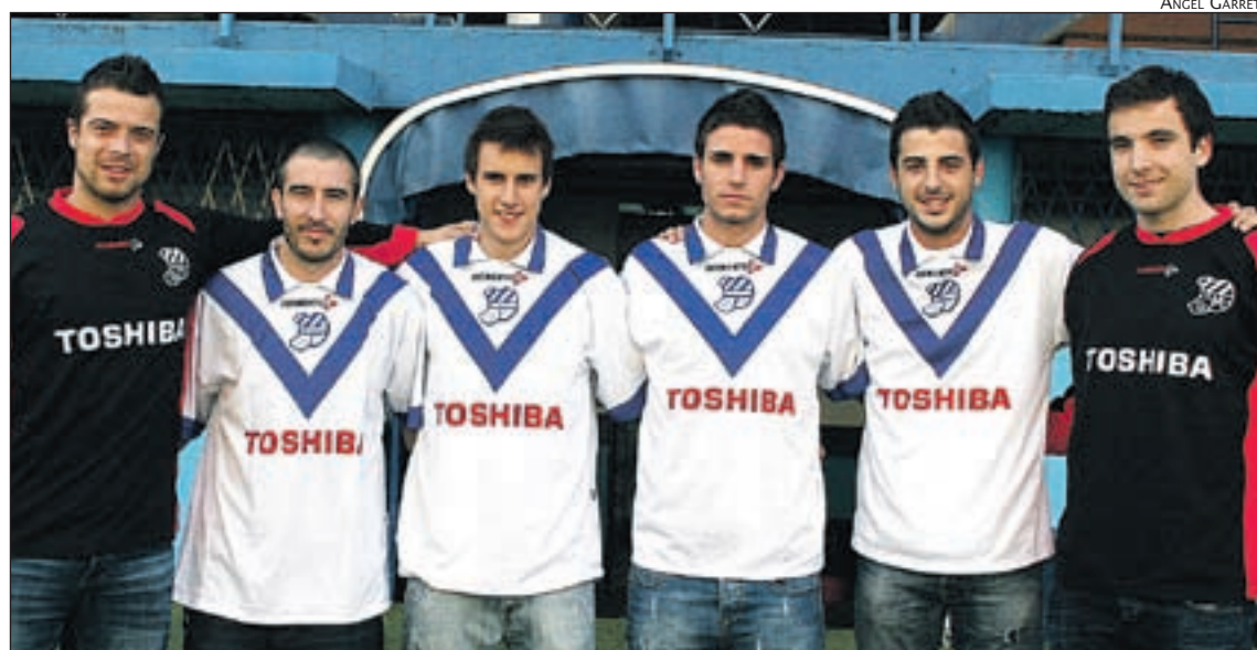
LES NOVES INCORPORACIONS DE L'EUROPA EN LA SEVA PRESENTACIÓ AL NOU SARDENYA

Els graciencs també recuperen "Peque", que es troba en el seu millor moment