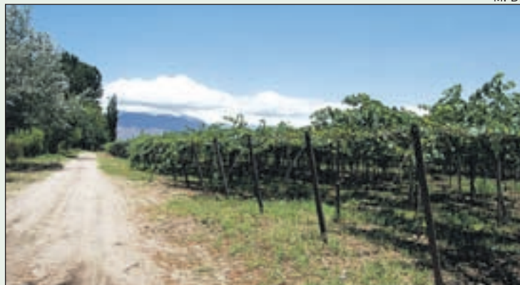
UNA DE LES VINYES DE CAFAYATE

cipici. En dies de boira, la tensió i l'angoixa estan presents, davant d'una boira que no deixa veure a dos centímetres, amb autocars que circulen de cara, i un precipi gairebé sense cap mena de protecció. Superada aquesta carretera de risc, Salta rep el visitant amb els braços oberts, perquè passi pels carrers i places amb nombroses construccions d'estil espanyol i la tranquil·litat de tota ciutat mitjana. ■