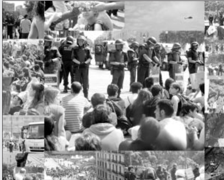
DIFERENTS IMATGES DEL DESALLOTJAMENT

No se'l deuen estimar gaire dins de CiU havent-lo posat de conseller d'Interior, ja que és una forma de cremar-lo políticament i de restar-li poder dins del partit. En tot cas, ningú l'ha obligat a acceptar el càrrec i la seva fatxenderia l'està perdent. A mi em sembla que Catalunya no demostrarà ser democràtica si el conseller Felip Puig no dimiteix perquè no ha estat a l'altura i el cas d'aquesta conselleria és molt greu. La conselleria d'Interior i els Mossos d'Esquadra tenen la facultat d'utilitzar la violència per impedir mals majors. Això és una responsabilitat molt gran perquè la violència envers qualsevol persona és inacceptable, menys encara des d'un estament oficial. Per tant, aquesta violència s'ha d'administrar amb moltíssima responsabilitat i cura, i només pot ser legítima per evitar un mal major. Un Mosso d'Esquadra té a disposició seva porres, kubotans i armes que disparen bales de goma o bales d'acer, per tant, poden fer molt de mal. Això ha de ser vigilat per la societat molt escrupolosament i qualsevol abús o mal ús d'aquesta facultat de fer mal legalment ha de ser fulminant per als culpables. Només així podem tenir la seguretat de poder garantir drets bàsics d'integritat física. Ningú els demana ser consellers ni ser policies, per tant no poden exigir-nos impunitat ni