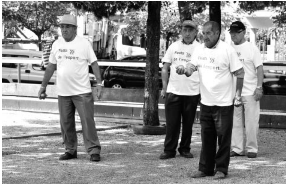
MEMBRES DEL CB PETANCA PARTICIPEN A LA FESTA DE L'ESPORT

Les entitats participants varen ser: la Unió Atlètica de Barberà que va celebrar una trobada; els Barberà Rookies CFA que va dur a terme una sèrie de partits de Futbol Flag; l'Escola de Natació que va participar a la jornada amb l'organització de jocs infantils aquàtics;