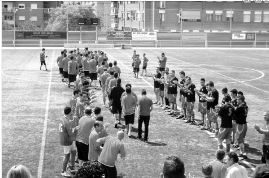
ELS EQUIPS DE L'ESCOLA APLAUDEIXEN ELS CAMPIONS