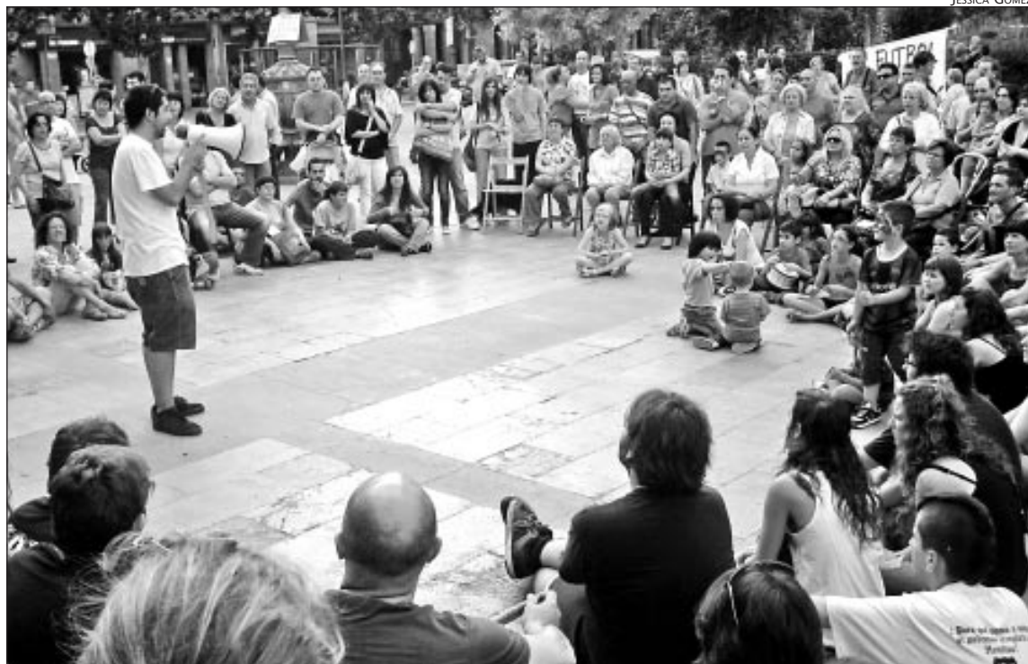
IMATGE D'UNA DE LES JORNADES

A més dels debats també ha sigut un espai per l'acció amb cercaviles reivindicatius per la ciutat o participant en les convocatòries de la Plataforma d'Afectats per la