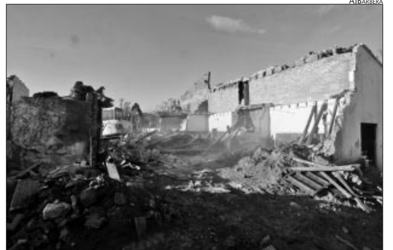
ENDERROCAMENT DE LA MASIA ON HA D'ANAR L'ESCOLA