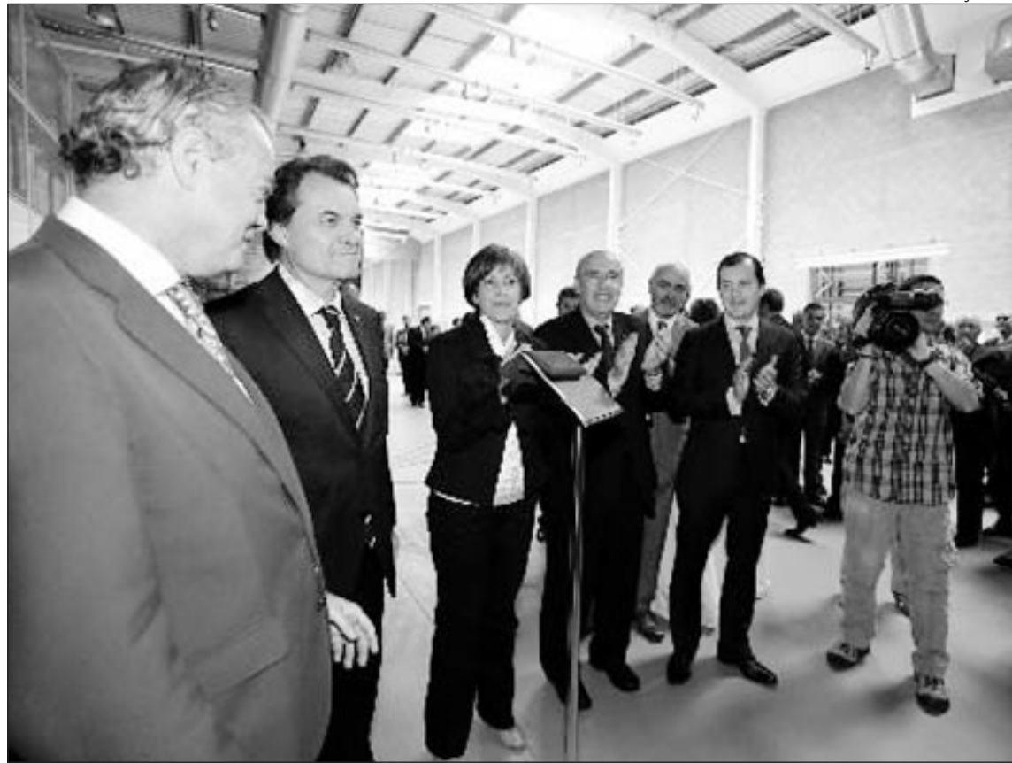
EL PRESIDENT, ARTUR MAS, AMB L'ALCALDESSA, ANA DEL FRAGO I LA RESTA D'AUTORITATS

El gruix de la inversió a Catalunya de Grup Cofares es focalitza en el nou magatzem de Barberà, on s'ha construït una nau amb una superfície de 10.000 m 2 i capacitat de magatzematge de 10.000 m 3 . Aquestes instal·lacions incrementaran la productivitat a mitjà termini. Aquest magatzem permetrà gestionar més de 28.000 referències de medicaments i productes sanitaris, i comptarà amb l'última tecnologia en robòtica i identificació per radiofreqüència. L'objectiu de Cofares és convertir aquesta instal·lació en el centre del seu negoci a Catalunya,