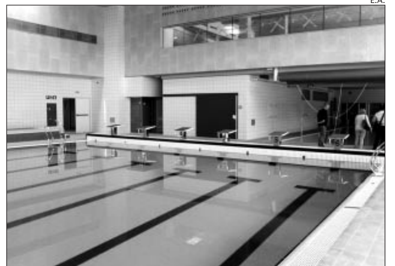
IMATGE DE LA NOVA PISCINA DEL COMPLEX MARIA REVERTER

A l'estiu, el sostre retràctil permetrà ampliar les possibilitats de les instal·lacions. El nou edifici també disposa d'una planta superior que estarà dedicada a activitats de condicionament físic, amb aparells per fer-hi exercicis cardiovasculars o aeròbic amb bicicletes i sales complementàries, mentre que el soterrani s'ha reservat per a les bombes i la maquinària per fer anar la piscina. La coberta superior disposa, finalment, de plaques