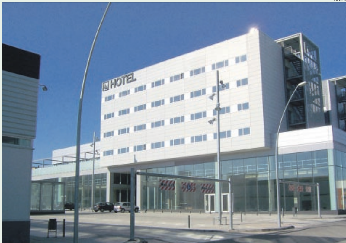
HOTEL EUROSTARS ARA EN ELS TERRENYS DE LA POLIGLAS

Aconseguir reunir a tantes persones no ha estat gens fàcil. D'aquesta manera explicava un dels organitzadors com s'ha aconseguit trobar a la gent: En aquesta ocasió la cosa no ha sigut gens fàcil ja que la majoria de aquell col·lectiu, uns treballen a altres empreses, d'altres ja son jubilats; també s'ha perdut la pista dels que han canviat de residència. No obstant i després de molt treball de recerca, hem aconseguit referències de uns 200 empleats i d'aquests 125 vindran a la Trobada dinar que es farà aquest