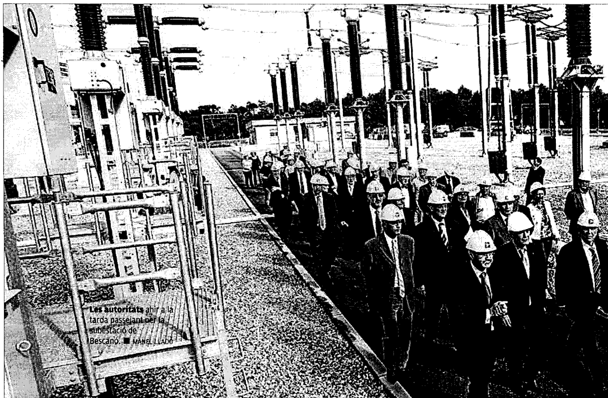
Les autoritats ahir a la tarda passejant per la subestació de Bescanó.