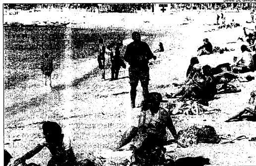
Una platja gironina en Setmana Santa, amb els primers banyistes.

El fenomen s'ha produït a la inversa en el global de l'Estat amb més increment dels clients estrangers. Les pernотacions realitzades en allotjaments turístics extrahotelers a Espanya (turisme rural, apartaments i càmpings) es van veure incrementades un 16,8% l'abril respecte al mateix mes de l'any anterior gràcies a la Setmana Santa. Segons les dades de l'Institut Nacional d'Estadística les pernотacions en apartaments, càmpings i cases rurals espanyoles van superar en total els 6,8 milions, impulsades sobretot per l'arribada de turistes estrangers que van augmentar un 21% les pernотacions