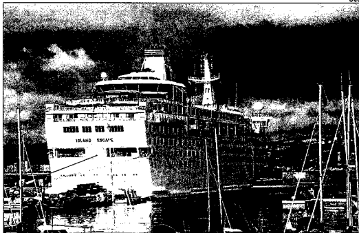
L'«Island Escape», de 185 metres d'eslora, ahir a Palamós.

L' Island Escape , que realitza una ruta d'una setmana per la Mediterrània occidental, va arribar a Palamós procedent del port de Niça i tenia previst salpar a la tarda cap a Palma de Mallorca. El cre-