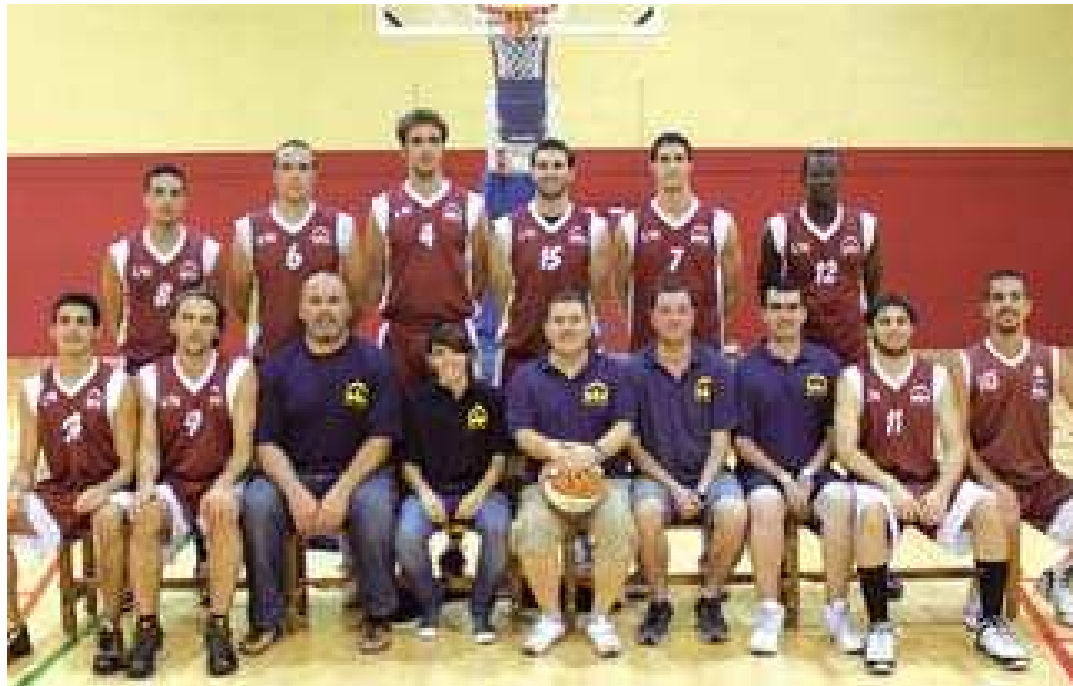
L'AEC Collblanc-Torrassa espera guanyar la Copa a la pista del Bàsquet Sitges

La fase final de la Copa Catalunya Masculina es va iniciar el cap de setmana del 14 i 15 de maig amb la participació dels equips classificats del primer al quart lloc dels dos grups de la fase regular de la màxima competició catalana masculina. Els