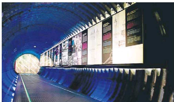
FONS MUSEU DEL SURO DE PALAFRUGELL

Ambientació aquàtica al Centre d'Interpretació de l'Aigua