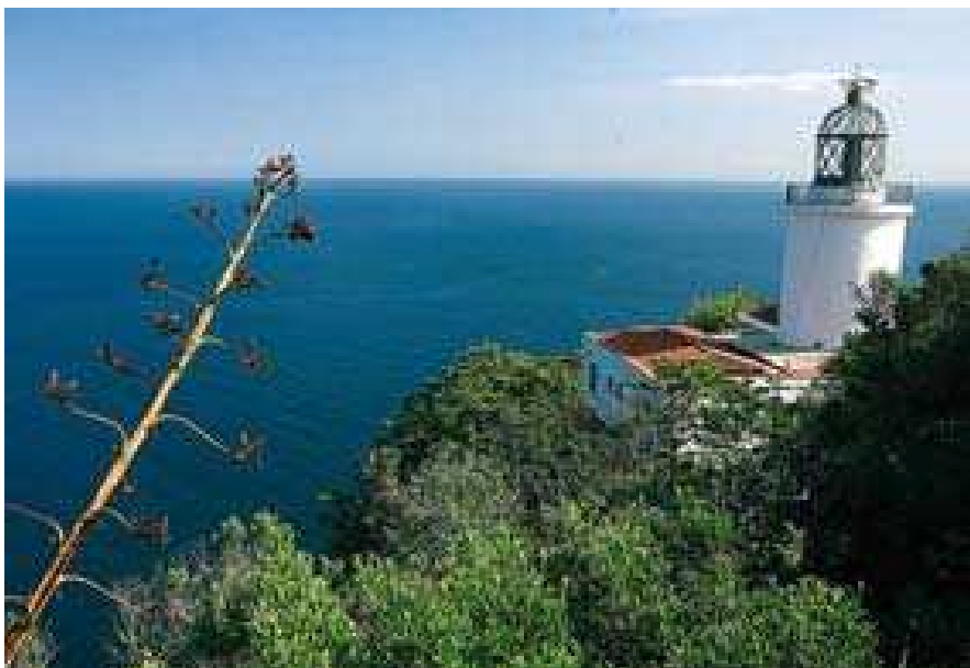
Des del far de Sant Sebastià es pot admirar una increïble panoràmica.