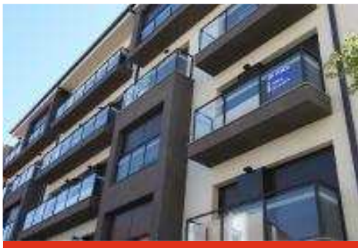
Un habitatge a la venda a Girona

El primer trimestre de l'any ha estat el "pitjor" de les dues últimes dècades pel que fa a la venda d'habitatges a la demarcació de Girona, segons l'estudi que publiquen semestralment el Col·legi d'Agents de la Propietat Immobiliària (API) i el Gremi de Promotors. Tot i això, s'entreveu una "tendència de recuperació" propiciada per la venda de pisos per part d'entitats financeres que volen aconseguir liquiditat a uns preus avantatjosos que estimulen la compra per part de particulars. Els preus dels habitatges nous i de segona mà se situen a nivells de l'any 2004 però cada població té un comportament diferent. Girona i Palamós són els municipis més cars per a la compra d'habitatges.