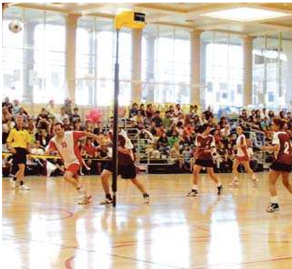
Els millors equips sènior i júnior es reuniran al pavelló de la Mar Bella

El duel CEVG – Vallparadís suposa una reedició de la final de la Copa Catalana d'enguany que es