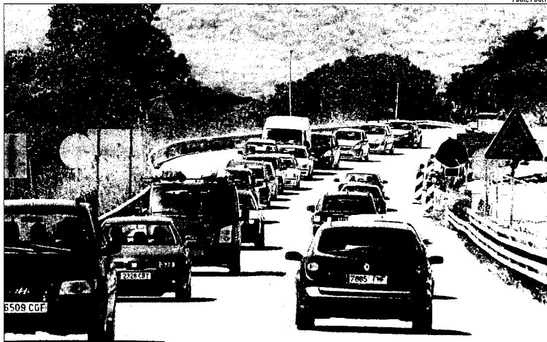
Obres a la C-31 en direcció a Palamós.

Per la seva banda, el departament de Territori i Sostenibilitat va manifestar la setmana passada que estaven oberts a parlar d'aquesta situació i al·legaven que la prohibició de tractors per l'autovia es feia sempre que hi havia un