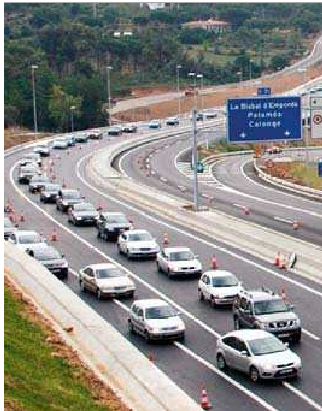
Una imatge de les cues que hi va haver ahir a la C-31 a Castell-Platja d'Aro ■ ACN

registrar a la C-31, amb 13 quilòmetres de cua entre Calonge i Castell-Platja d'Aro, i a l'N-340, amb nou quilòmetres de retencions de Torredembarra al Vendrell (Baix Penedès). També hi va haver cinc quilòmetres de circulació intensa a la C-32, a Mataró, i sis quilòmetres de circulació amb congestió a la C-25, l'eix transversal, a Arbúcies, i a l'AP-7, a Maçanet de la Selva, amb dos quilòmetres. Fins ahir a la nit no hi va haver cap accident mortal. ■