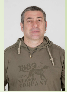
3. Pedro Castillo