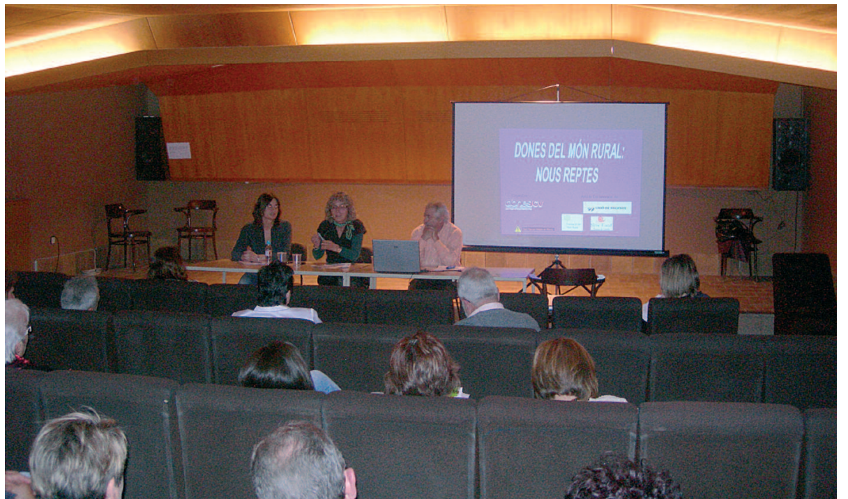
Imatge de la jornada "Dones del món rural: nous reptes", celebrada a Balaguer

es considerés necessari; que la visibilitat de les dones rurals sigui una realitat quotidiana; que atenguin les necessitats de les dones emprenedores; que vetllin per les oportunitats de formació permanent de les dones que viuen en l'àmbit rural, i per a la seva promoció en igualtat de condicions als homes; que promoguin els serveis públics bàsics en els espais de la població rural adreçats a la salut de les dones; que vetllin per la millora de les condicions de la mobilitat de les dones en la geografia del món rural en què viuen; que garanteixin l'accés de les dones rurals a la seva protecció social, especialment en allò que es refereix a les prestacions per jubilació o per viduïtat; que vetllin per la correcta atenció de les dones rurals en la seva ancianitat o quan s'escaiguin situacions de dependència personal; entre d'altres.†