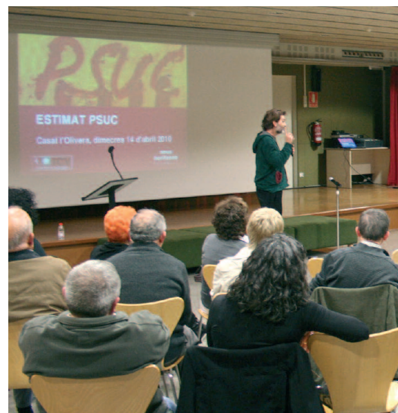
Un gran nombre de militants i simpatitzants van assistir a l'acte

Des del govern de la Generalitat es va destacar la creació del Memorial Democràtic, organisme encarregat de la recuperació de la memòria democràtica. També durant aquesta legislatura s'ha aprovat la Llei de Fosses, que vol garantir el dret de la ciutadania a saber què va passar, a conèixer el parador dels seus familiars i a recuperar-ne les restes, si és el cas, o dignificar l'indret on es troben.†