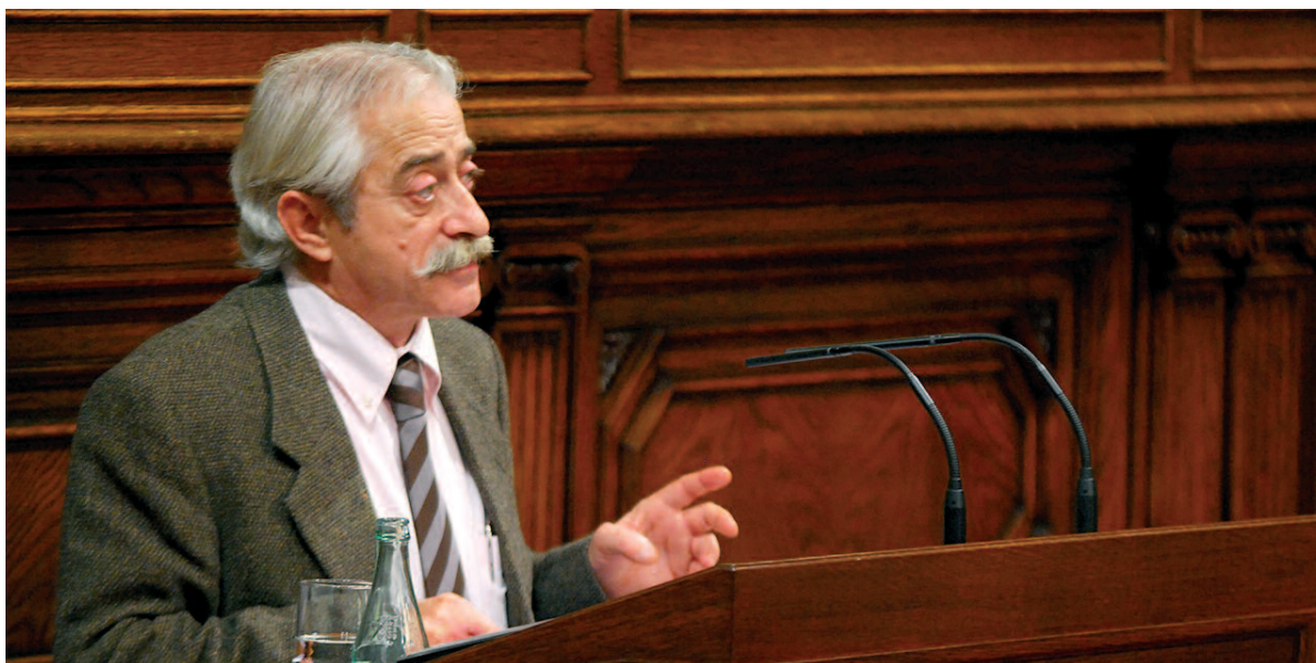
Francesc Pané, el 14 d'abril passat, durant la seva intervenció en el Ple sobre agricultura

Per tot això, el diputat per les Terres de Lleida va indicar la necessitat d'abordar un Acord Nacional per a l'Agricultura i l'Agroindústria a Catalunya que ha de ser la base per a una Llei Marc de Política Agrària de Catalunya. "Es tracta d'iniciar la nova cultura agrària i alimentària a Catalunya en què la concertació sigui tan important com la protecció, en què la producció es fonamenti sobre el coneixement, la transferència de tecnologia i les millors pràctiques; en què la participació dels productors en la transformació i en el comerç dels aliments sigui una de les bases empresarials del camp català; en què el suport de