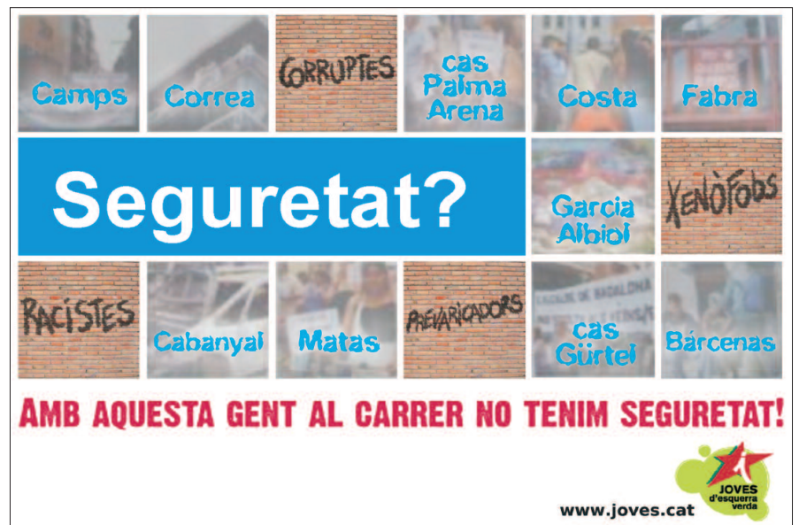
JEV va distribuir una postal electrònica que parodia la campanya "racista i xenòfoba" del PP a Badalona