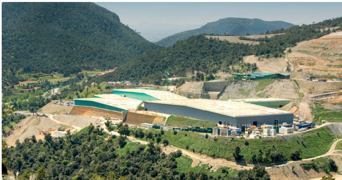
Centre de tractament de residus del Vallès Occidental, actualment en la seva última fase de construcció

La tasca d'ICV al govern en liderar la política de residus està donant bons resultats, en la línia del model de gestió que sempre hem defensat: fomentar la prevenció i aprofitar els materials mitjançant la recollida selectiva i el reciclatge.