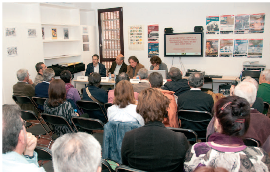
Imatge de l'acte celebrat al Museu Memorial de l'Exili, a la Jonquera

L'acte va comptar amb l'assistència d'una cinquantena de persones, d'entre les quals diversos familiars d'exiliats i exiliades; també hi va assistir l'alcalde de la Jonquera.†