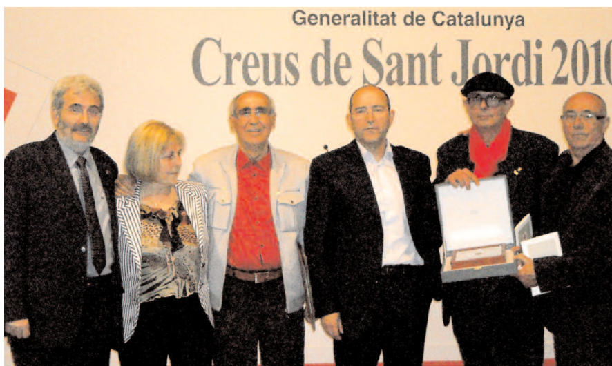
Els membres del Memorial Democràtic dels Treballadors de SEAT, amb la Creu de Sant Jordi

L'Associació per a un Memorial Democràtic dels Treballadors de SEAT va rebre el passat més d'abril la Creu de Sant Jordi per la reivindicació que fa aquesta entitat del patrimoni industrial i obrer de Catalunya, així com també pel suport constant a les iniciatives i polítiques públiques de memòria democràtica. Aquest reconeixement arriba en el seixantè aniversari de la fundació de l'empresa i s'atorga en representació de totes les persones que hi han treballat al llarg dels anys.