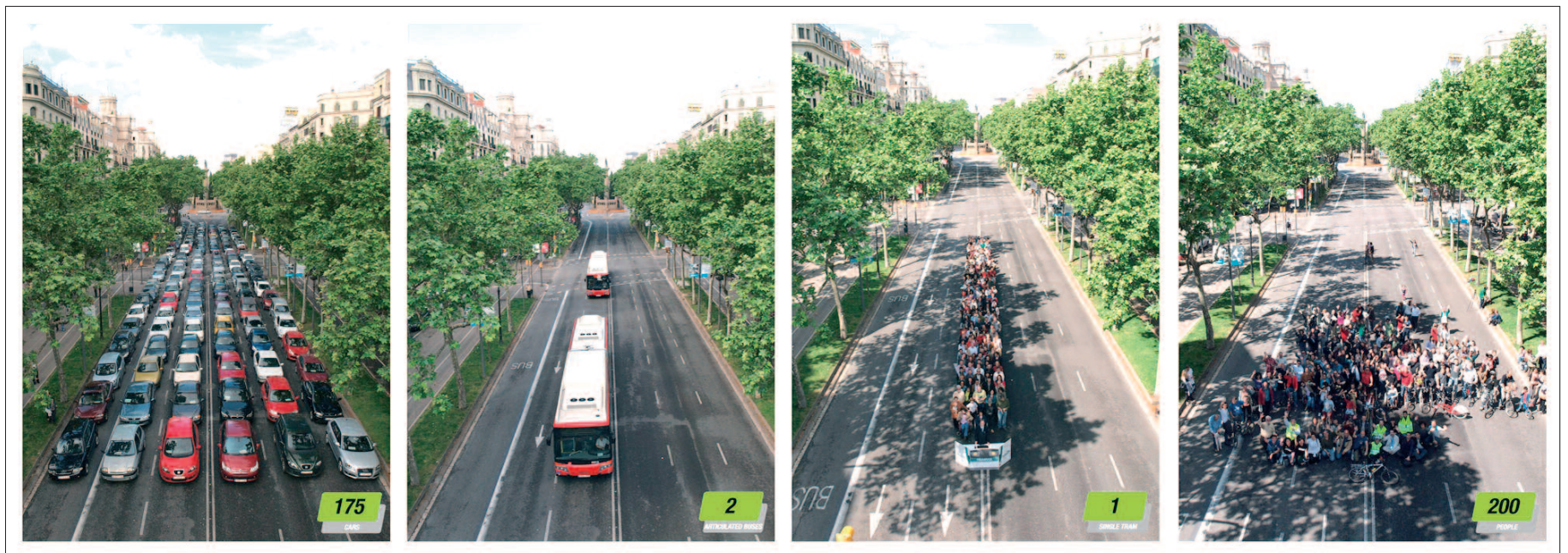
La PTP (Promoció del Transport Públic) va fer una demostració de capacitat de la mobilitat sostenible a la Diagonal

Per totes aquestes raons, la coalició ICV-EUiA demana que a la consulta es voti per la proposta A (bulevard) o la proposta B (rambla), ja que les dues aposten per la transformació de la Diagonal. L'opció C no proposa res i, per tant, suposa l'immobilisme.†