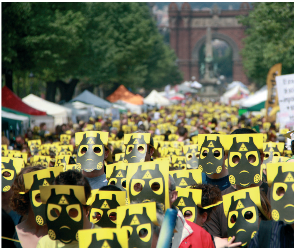
Acció en contra del cementiri nuclear d'Ascó, durant la Fira de la Terra, organitzada per organitzacions ecologistes i ICV

Podràs trobar més informació a: http://www.roadmap2050.eu/