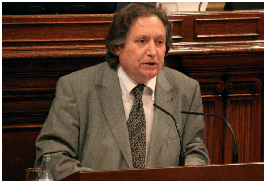
Intervenció de Jaume Bosch al Parlament, el passat 29 d'abril

Bosch va indicar que per al seu grup "la possible sentència frustrada de fa dotze dies era inacceptable i inassumible perquè vulnerava la voluntat del poble de Catalunya i perquè feia una interpretació de la Constitució que no era progressista sinó regressiva".