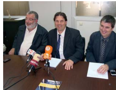
Moment de la trobada celebrada al Consell

juntes davant la gestió del transport escolar no obligatori. El Bages i l'Anoia assumeixen aquest servei, però veuen com els recursos minven, mentre el nombre d'escolars ha augmentat els darrers anys. Els dos òrgans demanen una solució definitiva a la manca de recursos. Durant la trobada també es va demanar que s'acceleri la construcció de la C-37.