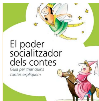
Imatge de la guia utilitzada durant el curs

on reflexionar i analitzar la influència dels contes en l'aprenentatge de rols de gènere, la resolució de conflictes i el procés de socialització a la infància, com una important eina de prevenció de la violència masclista. Per exemple, es va poder comprovar com en la majoria de contes els personatges femenins cuinen, netegen i ploren, mentre els masculins són forts, poderosos i lluiten, viatgen i treballen. La guia forma part del paquet educatiu que s'ofereix a les escoles.