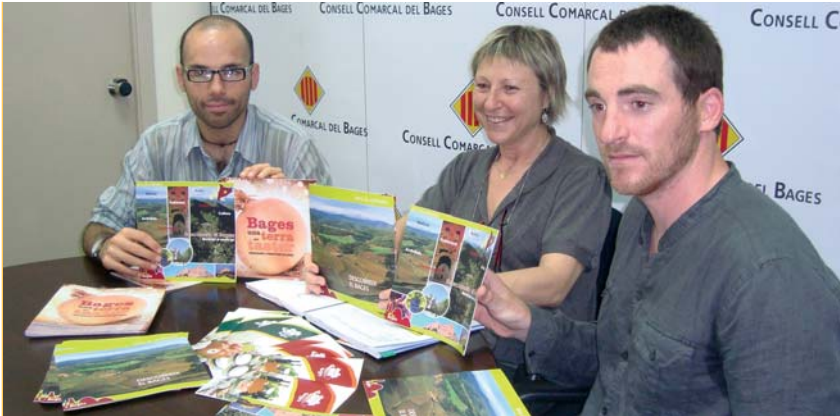
Presentació dels tres fullets informatius davant els mitjans de comunicació

El Consell Comarcal fa un pas més per promocionar de manera conjunta la imatge de la comarca més enllà del territori. L'edició de tres fullets informatius és el resultat de la darrera tasca que s'ha portat a terme en l'àmbit del turisme. L'ordenació de l'oferta turística de la comarca permet donar una visió global de les potencialitats de la marca Bages.