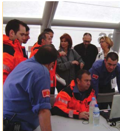
Pla d'emergències. Pla d'Assistència i suport en matèria de protecció civil. La comarca ha estat pionera a Catalunya amb aquest pla per millorar la coordinació enfront les emergències.