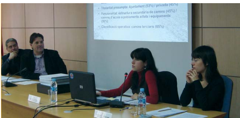
Inventari de camins. L'àrea de Territori i Medi Ambient ha elaborat un exhaustiu inventari de camins de la comarca. És una eina amb informació detallada de 4.406 quilòmetres de camins, pistes forestals i camins rurals que es complementa amb una pàgina web que permet la descàrrega de mapes i la consulta geogràfica ( http://camins.ccbages.cat ).