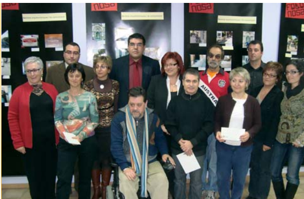
Al costat dels discapacitats. El Consell porta a terme una important tasca de sensibilització a la població de les dificultats que pateixen les persones discapacitades. El concurs 'Fotonosa' és un èxit i les activitats als instituts de la comarca també tenen bona acceptació.