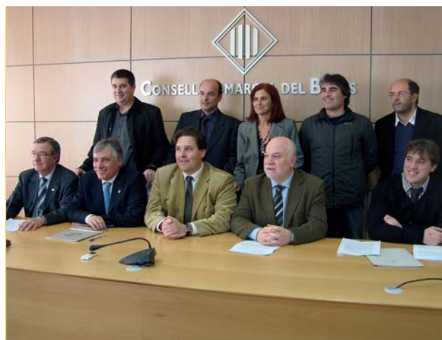
Lluita per a les infraestructures. El Consorci Viari de la Catalunya Central, del qual el Consell forma part, ha accentuat els darrers mesos les reivindicacions davant les administracions per aconseguir que el territori disposi d'unes infraestructures de qualitat.