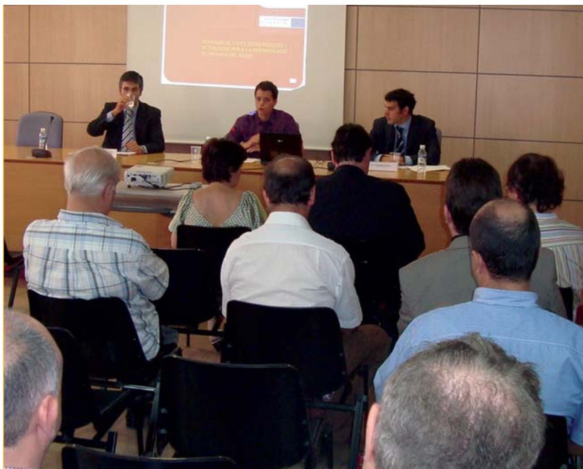
L'estudi encarregat pel Consell Comarcal ha comptat amb la participació de diferents agents

Davant aquest escenari que es planteja, el Consell Comarcal treballarà per aconseguir la diversificació de l'economia per fer front a la complicada situació que travessa la comarca. Els efectes de la crisi al Bages estan per sobre la mitjana catalana pel pes que ha tingut la indústria de l'automòbil i la construcció. L'ens pretén que l'economia del Bages no