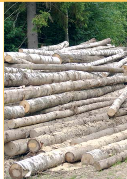
Gestió dels boscos. El Bages desenvolupa un projecte per fer estella per a calefacció amb la biomassa dels boscos que es netegen amb el suport de la Generalitat.