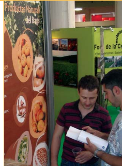
El Rebot del Bages. El Rebot dels Productes Naturals del Bages és el projecte del Consell i l'Ajuntament de Manresa que potencia els productes alimentaris del territori.