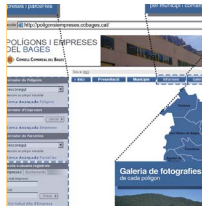
Informació dels polígons. La comarca disposa d'una pàgina web molt útil amb informació de 125 polígons industrials i dades de més de 6.000 empreses del territori.