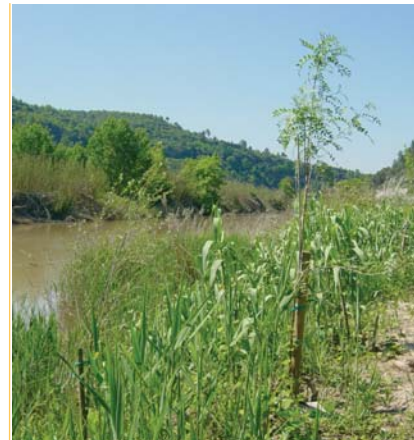
Rius verds. El programa 'Riu verd' promou la restauració dels boscos de ribera als rius Cardener i Llobregat. Es recuperen espais i es millora el seu estat ecològic.