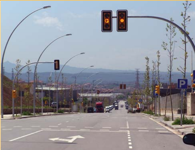
Mobilitat sostenible. El Consell ha desenvolupat una proposta de sistemes de transport sostenibles per millorar la mobilitat als polígons industrials. Es potencia el transport públic, la millora dels accessos per als vianants o la potenciació del transport compartit.