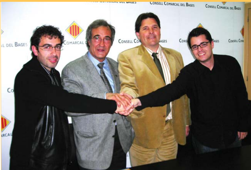
Trobades institucionals. El Consell Comarcal és conscient de la importància de buscar les sinergies necessàries amb els territoris propers al Bages. L'ens ha mantingut trobades amb representants dels Consells Comarcals del Berguedà, l'Anoia, el Solsonès, Osona i la Noguera que han servit per establir acords i planificar estratègies conjuntes.