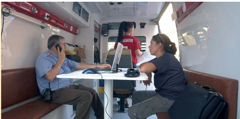
La nova unitat ja ha funcionat a ple rendiment durant els darrers mesos

La nova Unitat de Protecció Civil del Bages ja funciona a ple rendiment donant suport als 35 municipis del territori. Coincidint amb els mesos d'estiu en què s'han produït nombrosos incendis, el servei de protecció civil comarcal ha intervingut donant suport en la gestió de l'emergència oferint als alcaldes afectats el seu suport, comunicant la situació, informant sobre la seva evolució a CECAT i col·laborant principalment en tasques logístiques d'actualment en coordinació amb la