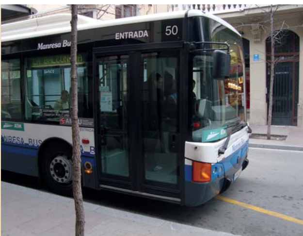
Integració tarifària. La integració tarifària és una realitat al Bages. Els usuaris es poden beneficiar d'aquest nou sistema tant en els viatges a la comarca, com en els desplaçaments fins a l'àrea metropolitana amb un estalvi econòmic important.