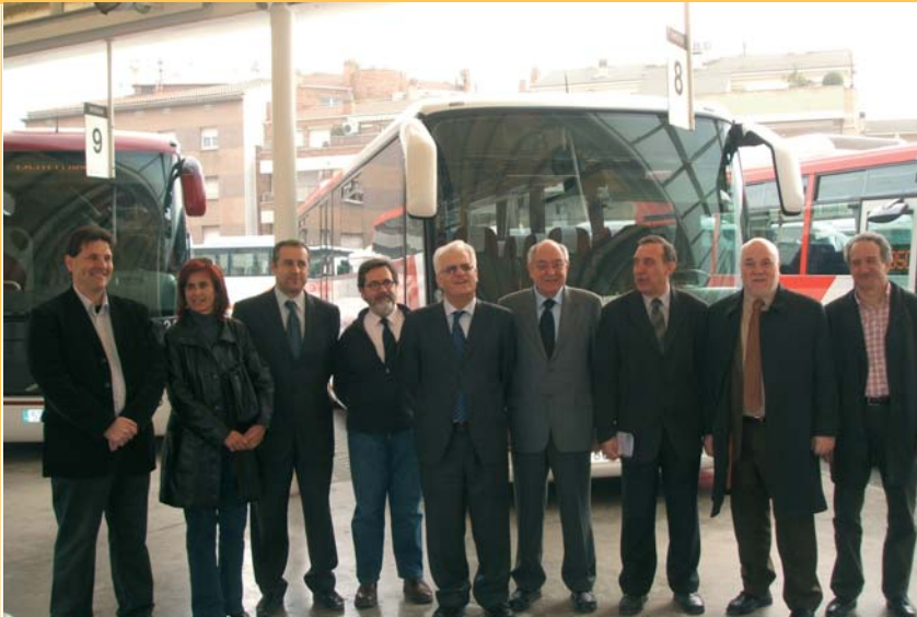
Més oferta de transport públic. El pla de millora dels serveis de transport públic de viatgers del Bages ha permès augmentar un 49% l'oferta de serveis d'autobús. Totes les línies interurbanes s'han reforçat i es preveu un guany de més de 200.000 usuaris. La iniciativa compta amb el suport de l'ATM amb una inversió d'1,6 milions d'euros.