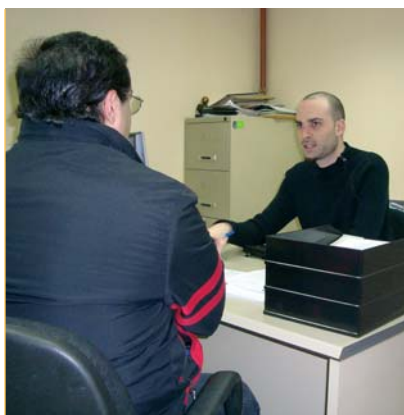
Protegir el consumidor. L'Oficina d'Habitatge i l'Oficina del Consumidor augmenten any rere any el nombre d'usuaris que reben suport per defensar els seus drets.