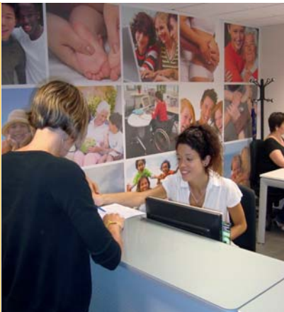
Millores en l'atenció. El Consell Comarcal ha renovat les dependències de Serveis Socials, ubicades a la planta baixa de l'edifici, per oferir un millor servei als usuaris.