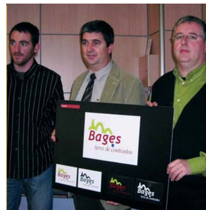
Marca Bages. La creació de la marca Bages ha servit per aglutinar totes les ofertes turístiques de la comarca i per relançar un sector amb grans possibilitats al territori.