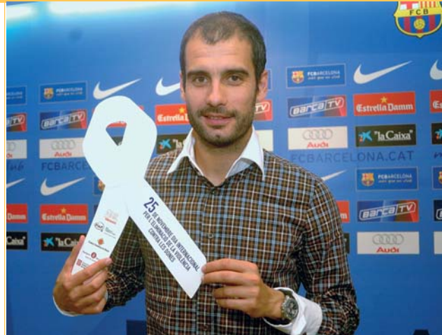
Potenciar la igualtat. L'àrea de la Dona treballa per denunciar les desigualtats de gènere. El Consell ofereix suport a les dones amb dificultats i multiplica els actes coincidint amb les jornades del Dia internacional contra la violència a la dona i el Dia de la dona treballadora.