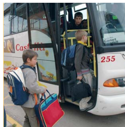
Ús referent de PDA. La gestió del transport escolar amb l'ús de PDA ha rebut el reconeixement del departament d'Educació. El sistema permet tenir més control dels trajectes.