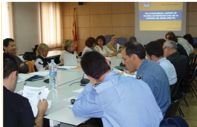
Unitat de Protecció Civil. La nova Unitat de Protecció Civil ofereix als municipis el seu suport en serveis de planificació, emergències i rehabilitació i treballa per donar resposta a qualsevol emergència que es pugui produir al territori a petició dels seus alcaldes.