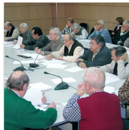
Amb la gent gran. La iniciativa 'Gent Gran Activa del Bages' fa difusió de les activitats culturals, d'oci i d'atenció i suport social que es fan a la comarca per a aquest col·lectiu.