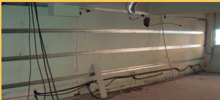
Al nou espai s'ubicarà el departament de Medi Ambient i l'espai de cuina-menjador.

L'edifici del Consell Comarcal continua un intens procés de remodelació. Aquest estiu els operaris han estat treballant a la primera planta amb una inversió de 141.000 euros.