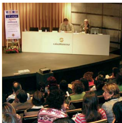
10 anys del SEAIA. El Servei Especialitzat d'Atenció a la Infància i a l'Adolescència va arribar als deu anys de vida el passat 2007. El servei continua la seva tasca.