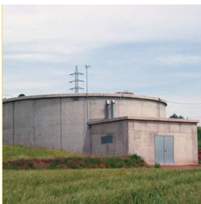
Fer arribar l'aigua. El Consell gestiona l'abastament d'aigua potable en alta dels sistemes sud i centre del Bages Cardener després d'importants inversions.