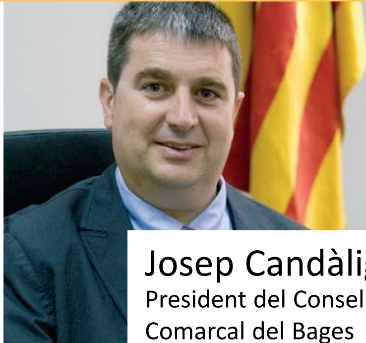
Josep Candàliga President del Consell Comarcal del Bages

El Consell ha demostrat tenir un paper important en l'optimització de recursos en benefici de tots els municipis, especialment els més petits... S'han fet molts projectes comarcals per mancomunar i cooperar amb els ajuntaments del Bages i per treballar en xarxa amb l'objectiu de millorar la gestió i optimitzar esforços per part de tothom. La compra agregada de serveis de telecomunicacions, un programa de cementiris municipals, la gestió del transport adaptat, un nou model de gestió dels menjadors escolars, l'optimització de les rutes de transport escolar, el servei comarcal de tramitació dels ajuts a la dependència, l'oficina de consum, la millora de polígons industrials, la gestió directa del servei d'aigua, l'arranjament de camins rurals, la consolidació del servei de protecció civil, els protocols de lluita contra la