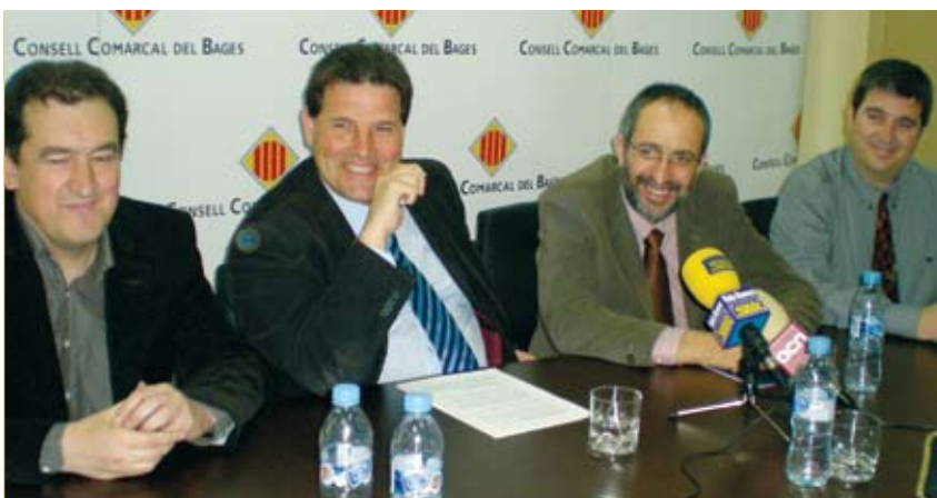
Reunió del Consell del Bages amb representants de la comarca d'Osona

Al llarg de la legislatura el Consell ha mantingut i reforçat la relació institucional i de cooperació amb altres comarques de la Catalunya Central. Les trobades han posat de manifest la bona sintonia i ganes de treballar en projectes conjunts en benefici del territori. Així, s'han treballat en projectes conjunts en temes de mobilitat, accessibilitat a polígons industrials, desenvolupament econòmic, formació i empresa, biomassa i energies renovables o rutes turístiques, entre d'altres.