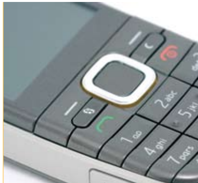
La telefonia mòbil encapçala el rànquing de reclamacions

L'any 2010 gairebé 4.000 ciutadans del Bages van resoldre algun dubte o reclamació en matèria de consum a través de l'Oficina Comarcal d'Informació al Consumidor (OCIC), gestionada pel Consell Comarcal. Manresa, Santpedor, Sant Joan de Vilatorrada, Sant Vicenç de Castellet i Navarces són els municipis de la comarca que tenen més persones que es van dirigir a l'OCIC. Les xifres d'usuaris, que augmenten any rere any, posen de manifest la creixent consciència dels ciutadans a l'hora de consumir i la importància per a la comarca de disposar d'un organisme com aquest, que a més de canalitzar les reclamacions i informar els usuaris sobre els seus drets, realitza mediacions entre empreses i consumidors en conflicte i fa una important tasca pedagògica, divulgativa i de formació.