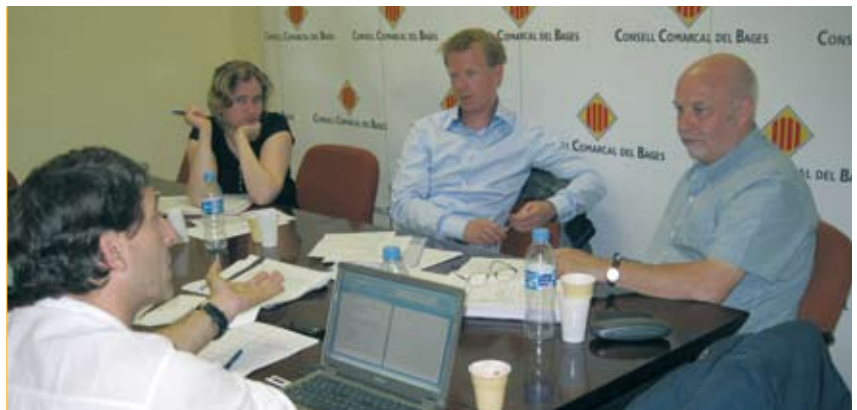
El disseny de mesures per millorar la mobilitat als polígons ha tingut la participació de tècnics europeus experts (a la foto), que han proposat experiències reeixides als seus territoris

Una altra de les línies de treball per tal de potenciar la reactivació de l'activitat a la comarca és la millora de la qualitat dels polígons existents. Des del Consell Comarcal s'ha promogut la realització d'estudis sobre les necessitats i mancances en matèria de TIC als polígons del Bages, que han donat com a resultat un seguit de recomanacions i propostes i la voluntat d'afavorir l'associacionisme entre les empreses per tal de tenir més força a l'hora de negociar millores i contractar serveis de forma comuna amb les operadores de telecomunicacions. La mobilitat és un altre dels aspectes en què s'incideix, en aquest cas per mitjà del projecte europeu Travel Plan Plus en què participen els municipis de Sant Fruitós de Bages i Santpedor que, després de Manresa, tenen els polígons que concentren el volum més important d'activitat econòmica, amb prop de 500 empreses i més de 6.000 treballadors. Un primer anàlisi de la mobilitat en