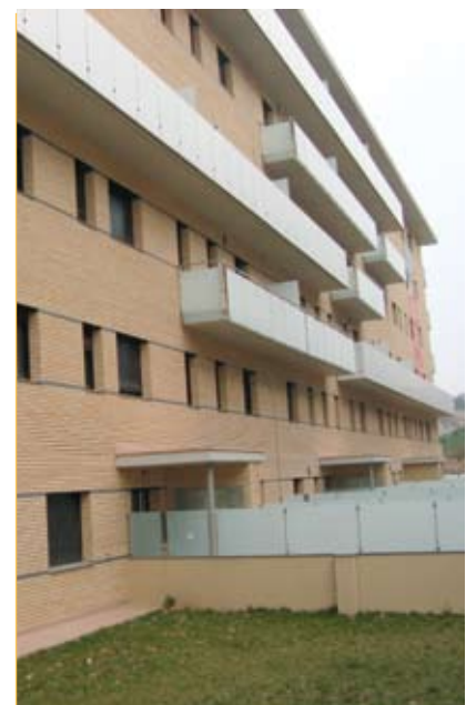
La crisi ha tingut efectes directes sobre el sector de la construcció, que es reflecteixen en l'activitat de l'Oficina d'Habitatge

Pel que fa a la rehabilitació, es detecta un increment de consultes sobre els ajuts de l'administració. L'any passat l'Oficina d'Habitatge va tramitar 106 expedients de sol·licitud.