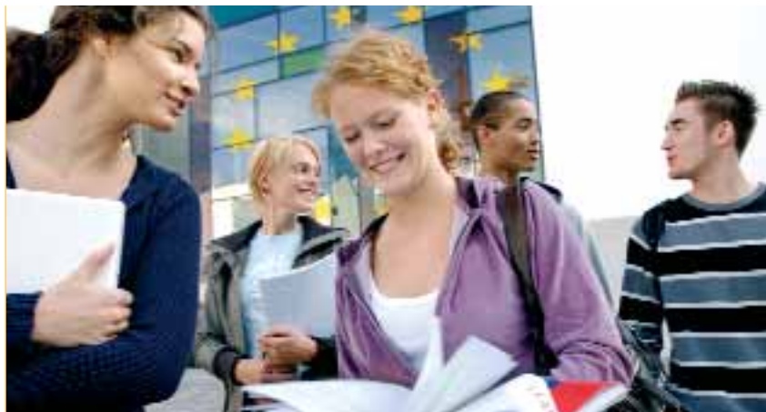
El programa permet als joves fer una estada d'entre 2 mesos i un any en un altre país europeu

La participació en el programa cobreix l'allotjament, el viatge, la formació, l'assegurança i una quantitat simbòlica per a diners de butxaca i manutenció. Malgrat els avantatges i valors associats a aquest servei, cap jove del Bages es va inscriure per poder convertir-se en voluntari europeu durant l'any 2009. En canvi, el Bages exerceix un paper acollidor molt actiu amb organitzacions com Ampans o Creu Roja que incorporen voluntaris. El Consell ha acollit darrerament voluntaris d'Alemanya, França, Grècia, Itàlia i Turquia que han participat activament en projectes.