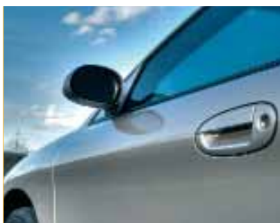
La campanya informativa es durà a terme entre tots els concessionaris de Manresa