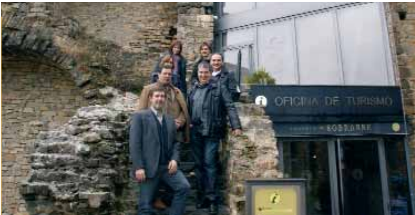
Responsables tècnics i polítics del Consell Comarcal van visitar recentment el Parc Geològic de Sobrarbe, a l'Aragó, per tal de conèixer-ne les instal·lacions i el seu funcionament

El Centre Unesco Catalunya avala la candidatura del Parc Geològic del Bages a esdevenir membre de ple dret de la European Geopark Network de la Unesco. Unesco destaca el compromís de la comarca amb la sostenibilitat i la preservació dels valors del territori.