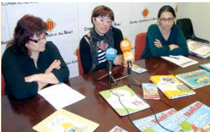
La biomassa és un recurs energètic sostenible i necessari per mantenir els boscos nets

L'àrea de la Dona del Consell Comarcal del Bages ha posat el punt i final a la campanya adreçada a la comunitat educativa que ha tingut lloc els darrers tres anys i que ha fomentat els valors i la convivència. Un total de 31 escoles de la comarca de 16 municipis han participat en aquesta iniciativa que es va tancar amb una festa adreçada a les famílies. La campanya ha fomentat aspectes com l'educació per la pau i la resolució no violenta dels conflictes, ha pro-