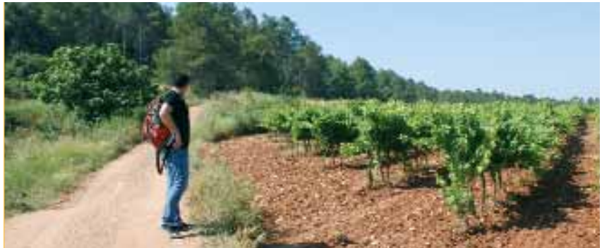
El senderisme és una de les millors maneres per conèixer i gaudir de la comarca

Les noves accions també preveuen la creació i la comercialització de paquets turístics amb l'objectiu de fomentar les estades de cap de setmana a la comarca. I afavorir el