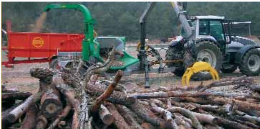
La biomassa és un recurs energètic sostenible i necessari per mantenir els boscos nets

El Consell Comarcal del Bages ha planificat, a curt termini, noves accions per consolidar el paper que ha assumit en el foment del consum de la biomassa com a recurs energètic sostenible i necessari per ajudar a netejar els boscos del territori. El proper pas substancial és el de formar i sensibilitzar els professionals tècnics perquè coneguin les característiques d'aquesta matèria primera que, com a combustible, es comercialitza en diferents formats, entre els quals hi ha l'estella o el pellet.