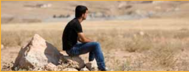
FIGURA AMB PAISATGE

La crisi ambiental és de debò una crisi del medi ambient o és la crisi de les nostres aspiracions, valors i hàbits? Hem gastat molta energia per satisfer les nostres necessitats, a la nostra mesura. Ara estem disposats a gastar encara més per evitar les conseqüències dels canvis que hem causat. Però, no és el moment per canviar nosaltres mateixos?