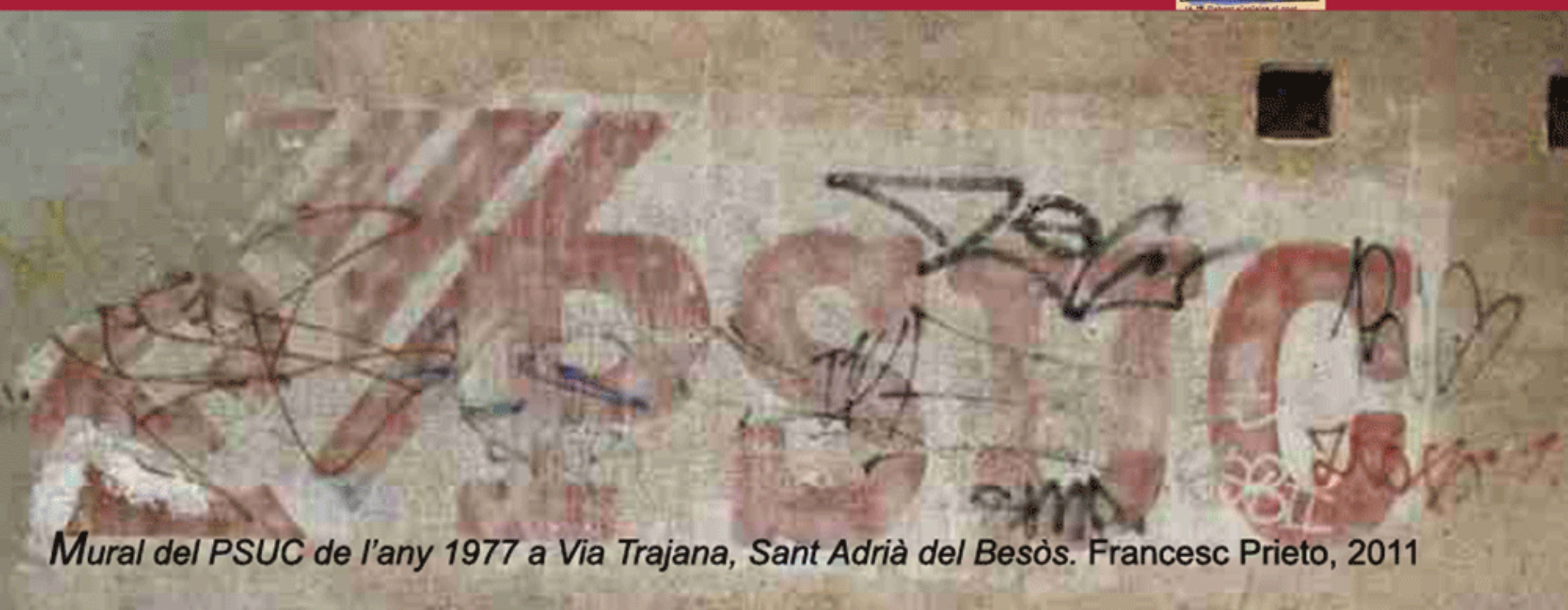
Mural del PSUC de l'any 1977 a Via Trajana, Sant Adrià del Besòs. Francesc Prieto, 2011

Com hereus del PSUC no deixem de recordar aquest 75è aniversari.