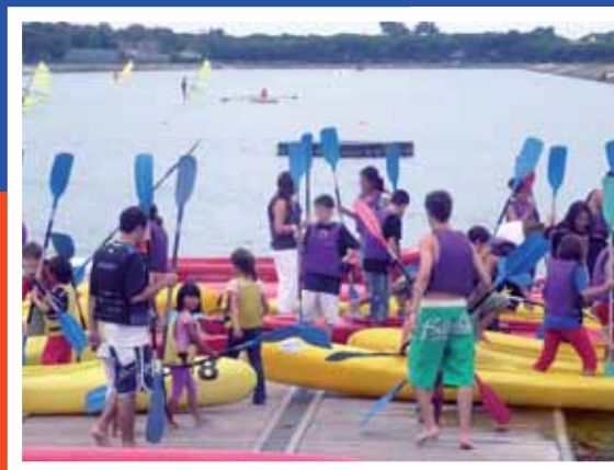
The Meeting Point al Canal Olímpic

ADULTS I JOVES ADULTS. Grups molt reduïts (4-6 alumnes per classe)