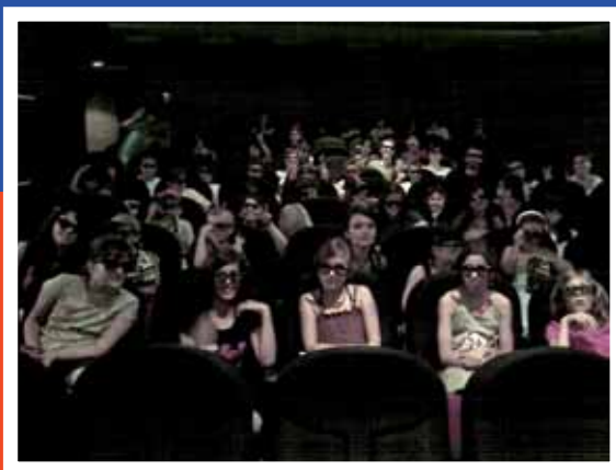
The Meeting Point al cinema en V.O.S.E. en 3D

Visita'ns a FIRESPLUGUES el 7 i 8 de maig. T'hi esperem!