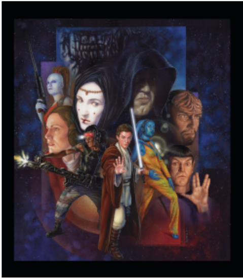
Pòster per a un espectacle d'Iguana Events. Acrílic i llapis de color (2003)

pàgina, com fa els personatges i la força que tenen. És un especialista a l'hora de col·locar les coses perquè l'ull et vagi on vol que vagi. Ell et dirigeix i et controla la mirada! I això és molt difícil saber-ho fer.