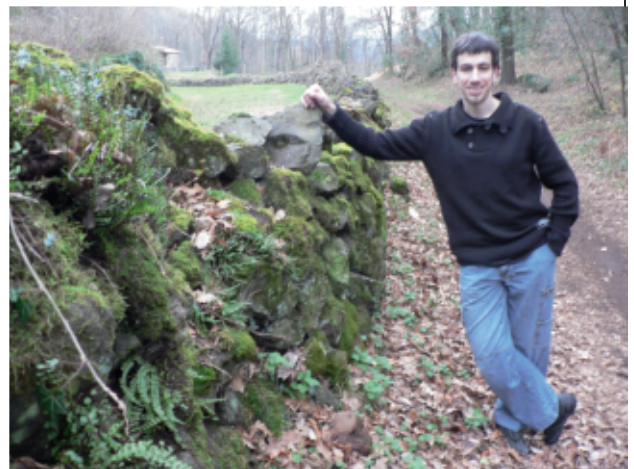
El dibuixant a la Fageda d'en Jordà, a la Garrotxa, al costat del nucli de Sant Miquel de Sacot, d'on és la seva companya i on viu actualment.

limitat, i en canvi allà tens moltíssimes possibilitats de feina. A la zona de Los Angeles i San Francisco a cada cantonada hi ha des d'empreses de videojocs fins a les productores de cinema més grans del món.