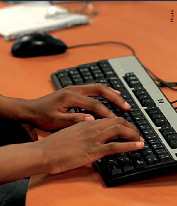
Alguns intenten introduir noves formes d'esclavitud a Europa

La crisi econòmica, l'atur i la retallada de drets laborals i socials afecten directament la cohesió social, sobretot si s'acompanyen d'un discurs que busca enfrontar les persones segons el seu origen. Això lamentablement és el que passa amb els discursos d'algunes forces polítiques –i no estem parlant només del PP o de Plataforma per Catalunya– que erròniament pensen que assumint part del discurs xenòfob frenaran l'avenç de l'extrema dreta.