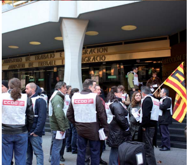
L'assemblea de delegats i delegades a la Farga i el tancament a les oficines de la Seguretat Social han estat diferents formes de pressió contra la proposta de 67 anys de jubilació