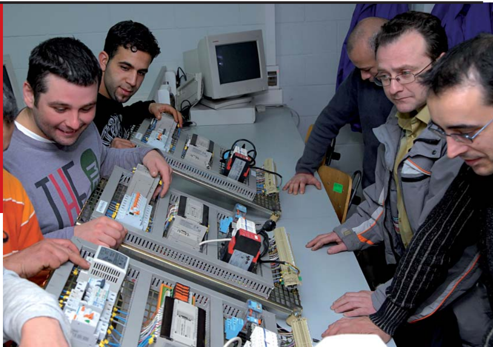
Continua sense millorar la incorporació al mercat de treball dels col·lectius prioritaris dels programes d'ocupació

Val a dir que els col·lectius prioritaris dels programes d'ocupació –persones aturades joves, entre 16 i 30 anys, i majors de 45 anys– no han vist com millorava la seva presència en el mercat de treball ni amb les bonificacions a la seva contractació ni amb els contractes formatius. Sembla que les empreses que aposten