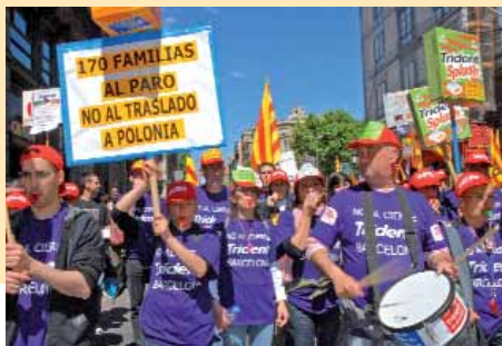
Els treballadors de Cadbury es fan notar contra el tancament de la planta del Prat de Llobregat

les plantilles de Bic Graphic i Bic Iberia es van mobilitzar en protesta pels 99 acomiadaments anunciats per l'empresa.