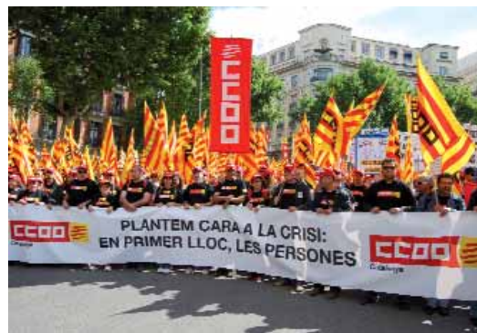
1.800 sindicalistes de CC OO de Catalunya van participar en la manifestació de Madrid

públics. L'Estat del benestar ha de sortir reforçat de la crisi perquè és indispensable per assolir un nivell suficient i necessari de cohesió social. També ho és la protecció del poder adquisitiu de la classe treballadora i la seva participació en els processos de decisió per tal d'assegurar una distribució equitativa de la riquesa que genera el treball. Aquests són els elements que defensa la CES per superar la situació actual, i són també les senyes d'identitat del projecte europeu des dels seus orígens. Europa és un model d'eficiència econòmica, sí, però és també un model de convivència, de solidaritat i d'eficiència social. Per aquesta raó les llibertats del mercat no poden estar per sobre dels drets fonamentals de les persones, i per això el Consell, la Comissió, el Banc Central, el Tribunal de Justícia o el Parlament europeu han de posar en primer lloc la defensa dels drets i interessos de la ciutadania. Per combatre la crisi, però també per fer realitat l'única Europa possible, l'Europa social.