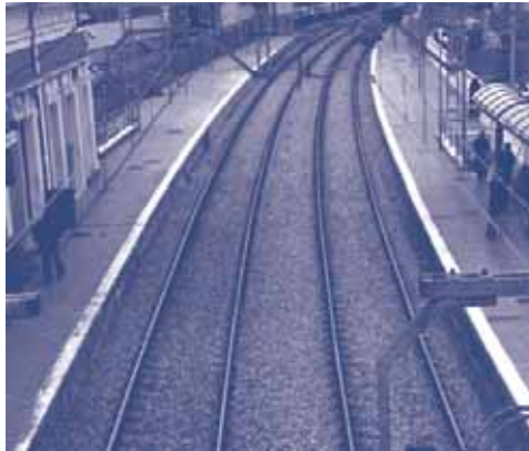
Catalunya pateix insuficiències històriques per falta de finançament

L'aprovació de l'Estatut ha significat canviar un model de finançament que fins ara és injust territorialment i, per tant, injust per a les persones. El retard en la seva aplicació i aquesta gasiveria en el càlcul dels diners generen desigualtats entre la població catalana i la