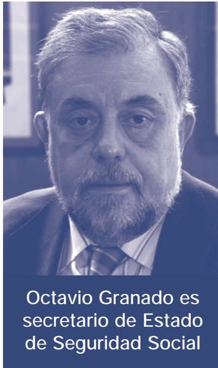
Octavio Granado es secretario de Estado de Seguridad Social

El Congreso de los Diputados inició en el último trimestre de 2008 la revisión del Pacto de Toledo. Esto significa que se abre un periodo de comparecencia de responsables del sistema de pensiones, empresarios, sindicatos y expertos, para que posteriormente los grupos parlamentarios hagan sus propuestas. Posiblemente en el primer semestre de