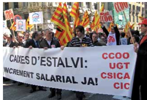
L'actitud de la patronal de caixes genera desconfiança

Ara mateix, les direccions de les caixes han incomplert el conveni col·lectiu sense arguments de pes, en un moment com l'actual en què la crisi econòmica es fa molt present. CCOO denuncia la gravetat que suposa aquest incompliment: en lloc de la tranquil·litat i confiança que s'hauria d'exigir, l'ACARL afegeix tensió en generar dubtes sobre les raons esgrimides per no aplicar el conveni. Els sindicats han demanat a la patronal la mateixa responsabilitat que ells assumeixen, tenint en compte que la conflictivitat no beneficia ningú, i expliquen que no hi ha una altra resposta quan es vulneren els drets dels treballadors i treballadores.