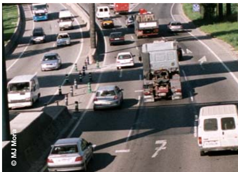
La mobilitat per motius laborals representa el 20% dels desplaçaments

El Decret 152/2007, impulsat per la Generalitat l'any 2007, preveu una sèrie de mesures destinades a restablir la qualitat de l'aire a 40 municipis de la RMB, declarats zona de protecció especial. Entre les mesures relacionades amb la mobilitat, fora de les mediàtiques relacionades amb la limitació de velocitat, una de les més importants era l'obligatorietat de redactar plans de desplaçaments d'empresa, abans del 31 de desembre de 2008, en els centres de treball privats de més de 500 treballadors/es, i públics de més de 200. En total, es calcula que el nombre d'empreses afectades és d'unes 200. Segons dades de l'ATM d'abril de 2009, els plans presentats són 12, i només 2 estableixen objectius quantificats de millora de la situació ambiental. Aquesta situació és especialment greu si tenim en compte que la mobilitat per motius laborals representa