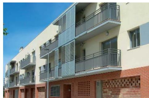
A Catalunya hi ha un estoc de 65.000 habitatges de nova construcció

A més, l'Administració ha de fomentar programes de rehabilitació i millora dels edificis que ho necessitin, potenciar les