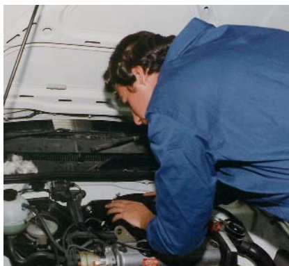
El sector de reparació de vehicles perd autònoms

Totes aquestes dades, doncs, ens han de servir per analitzar la situació del col·lectiu autònom al nostre país, en aquests moments de forta crisi econòmica, i poder proposar millores en el camp de l'autoocupació.