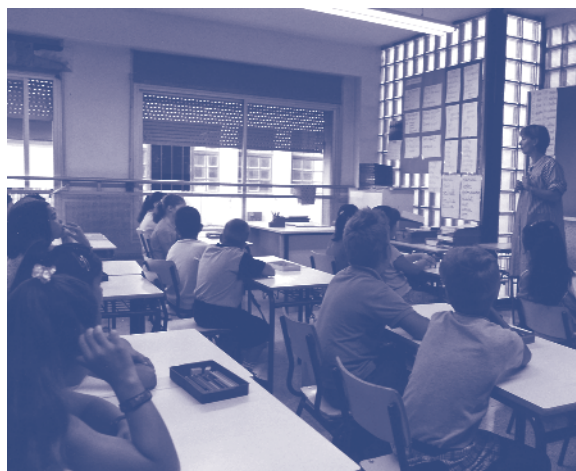
Les plantilles de mestres tindran sobrecàrrega de feina

CCOO té molt a dir en la defensa dels serveis públics, perquè són la riquesa dels que no som rics. CCOO té molt a dir sobre la responsabilitat dels poders públics en la creació d'ocupació quan l'atur s'estén. CCOO té molt a dir en la promoció d'una economia que compe-