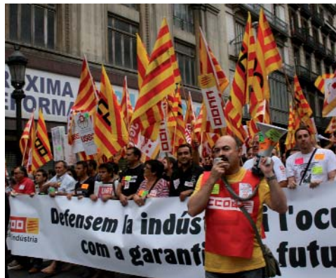
La xifra d'afectats per ERO a Catalunya supera les 65.000 persones

L'any 2009 està mostrant una clara tendència a l'alça pel que fa als expedients de regulació d'ocupació. Així, la xifra d'afectats per ERO a Catalunya és, fins ara, de més de 65.000. A més, una estimació de CCOO preveu que un terç dels expedients de suspensió temporal de contractes es pugui transformar en acomiadaments en els propers mesos, amb la qual cosa prop de 21.500 persones més podrien perdre la feina. Amb tot, i malgrat la importància real i mediàtica