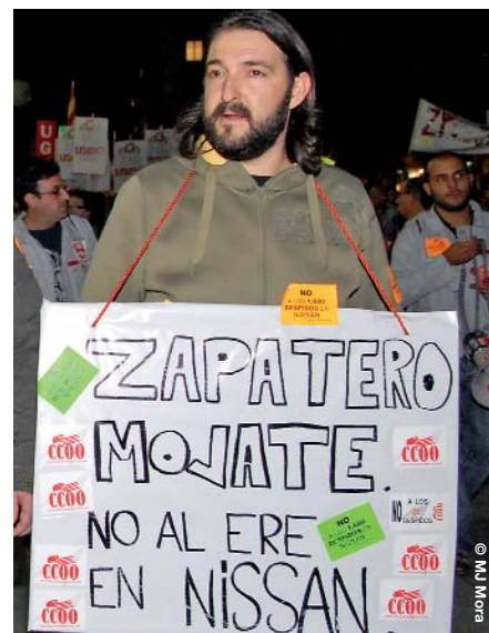
CCOO ha presentat un recurs contra l'ERO de Nissan

de temporal per a 234 persones més, de les quals 110 pertanyen a la planta catalana. Els treballadors estan duent a terme mobilitzacions de protesta contra la mesura, mentre CCOO exigeix a la multinacional el manteniment de les tres plantes espanyoles (a més de la de Gavà, té la d'Alcalá de Henares i la d'Alcalá de Guadaíra), especificant el nombre de treballadors i de producció amb què es mantindrien. El sindicat recorda que no admetrà acomiadaments sense un pla social i prejubilacions, que impedeixin la sortida traumàtica dels treballadors afectats. També a Sharp s'exigeix un pla industrial de futur, que reculli l'adjudicació de noves càrregues de treball i nous productes, que garanteixin el volum de plantilla