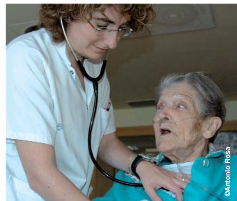
Calen més professionals en l'àmbit de la salut

La manca d'aquests professionals en l'Administració fa que empitjorin les condicions de treball dels empleats públics que ja hi treballen actualment, ja que calen més recursos per mantenir una qualitat adequada dels serveis que s'ofereixen. És per això que CCOO demana a la