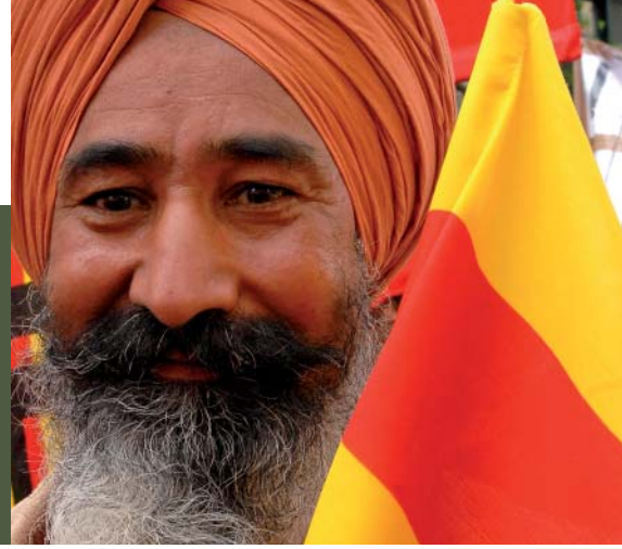
La societat catalana s'ha de mobilitzar contra les actituds xenòfobes i racistes