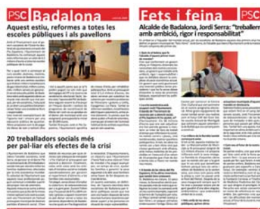
Boletín bimestral Partido Socialista.

Federaciones, asociaciones, gremios y empresas pueden usar este servicio para dar a conocer periódicamente a sus clientes y asociados la actualidad, novedades, y servicios que ofrecen. Ejemplos: