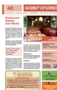
Boletín "Federació Empresarial de Badalona".