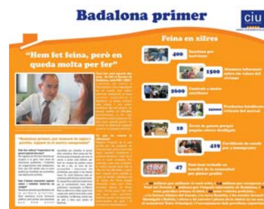
Boletín trimestral Partido "Convergència i Unió".