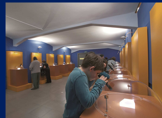
MUSEU DE MINIATURES