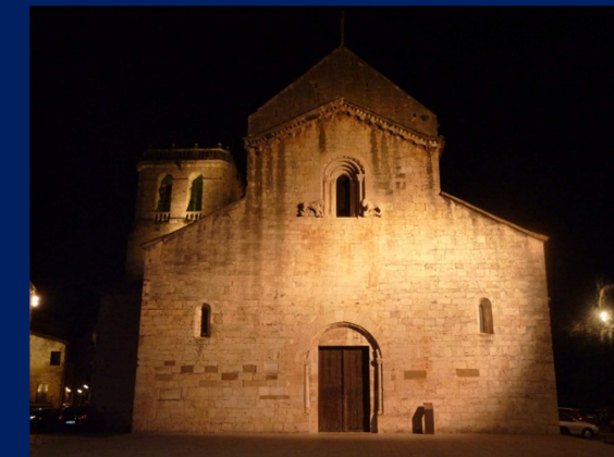
MONESTIR SANT PERE