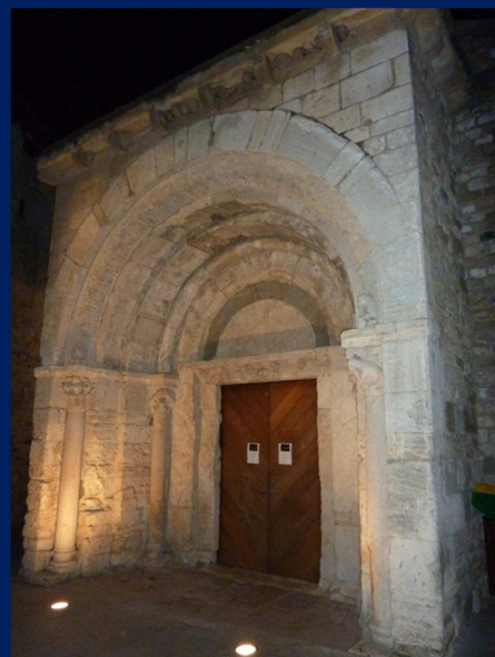
HOSPITAL SANT JULIÀ