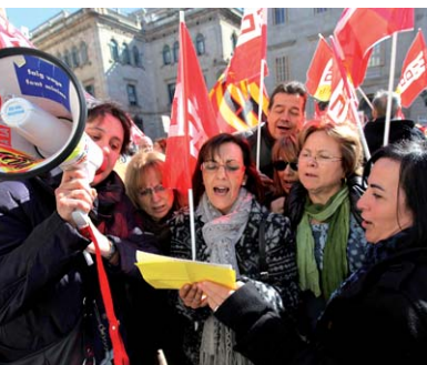
Concentració de treballadors/es de la sanitat

La Generalitat ha decidit reduir un 10% el pressupost, fet que tindrà un impacte molt dur sobre l'ocupació pública. CCOO considera que es poden destruir més de 16.000 llocs de treball a la Generalitat. A aquestes xifres caldria afegir l'impacte en serveis públics concertats, com la xarxa hospitalària d'utilitat pública, on segurament s'afegirien 4.000 llocs de treball destruïts més.