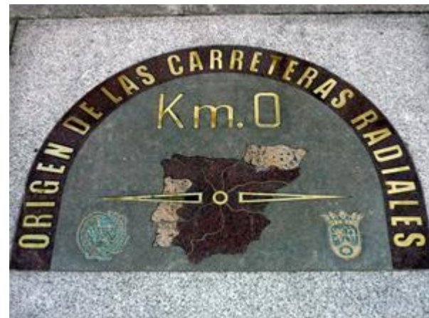
(Puerta del Sol, Madrid)