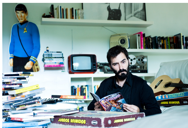
The New Raemon