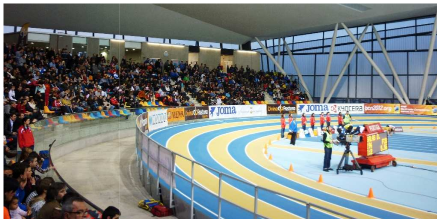
Fotos (superior i inferior esquerra): Mitja Marató de Barcelona Foto (inferior dreta): Campionat d'Espanya en pista coberta Sabadell