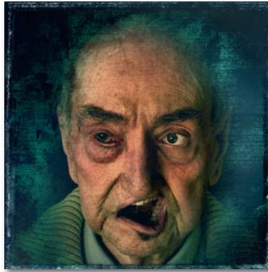
Premi d'Honor Quim Botey