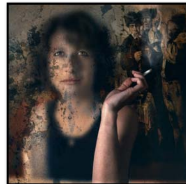
Terce premi M a Gracia de la Hoz